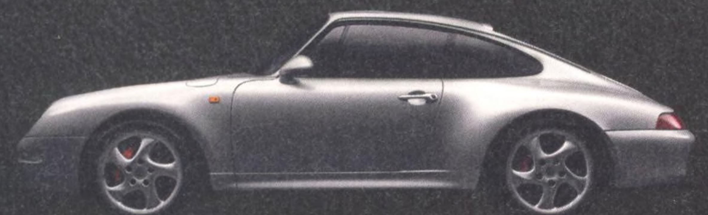
993 Carrera S