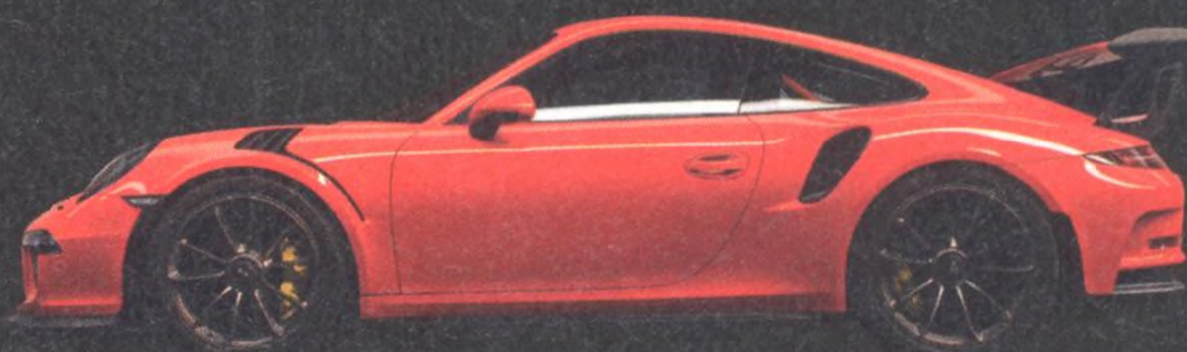
991.1 GT3 RS 136