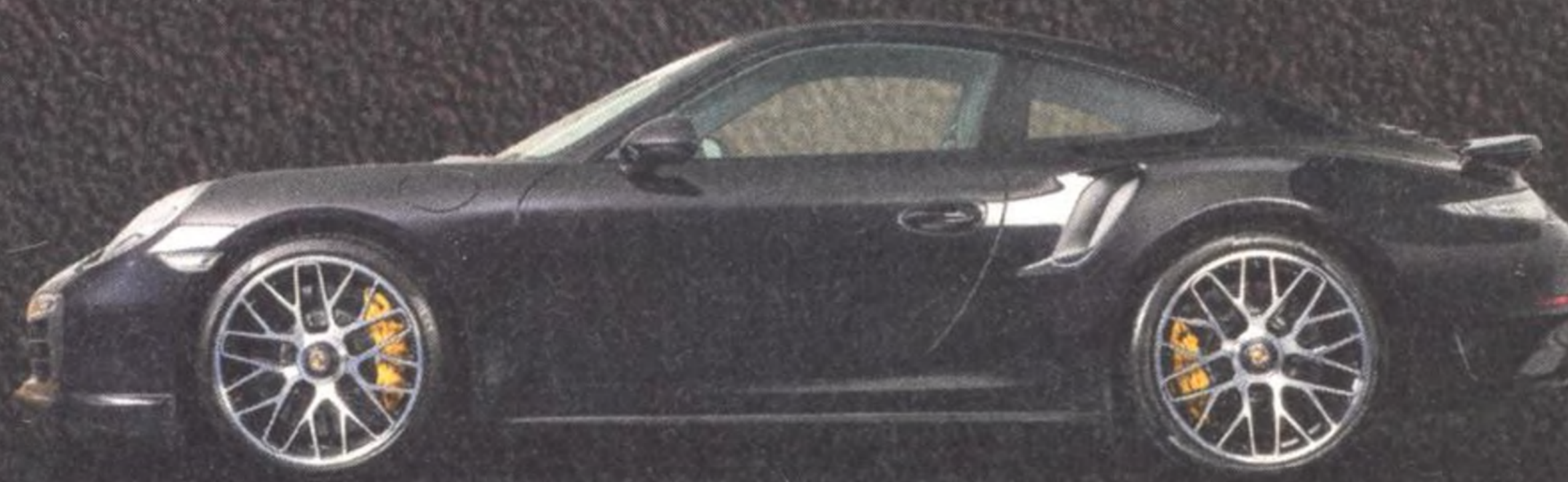
991.1 Turbo S