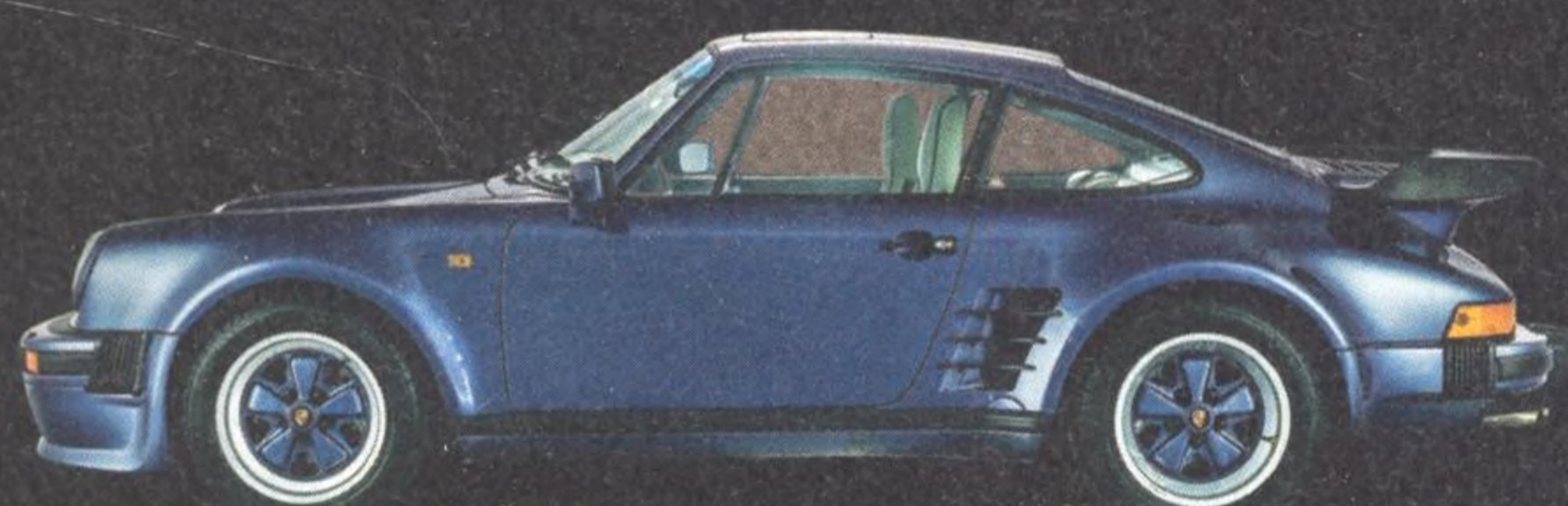
930 Turbo LE 086

Jen málokteré auto se vyrovná ikonickému modelu 911 Turbo. Jde-li o váš vysněný sporták, pomůžeme vám se správně rozhodnout, který z modelů 930, 964, 993 a 997.1 Turbo vybrat