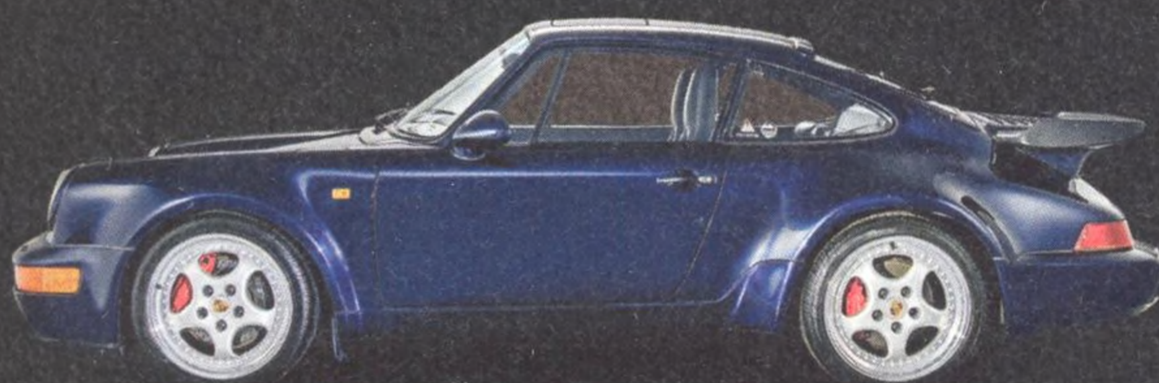
964 Turbo 3.6 094