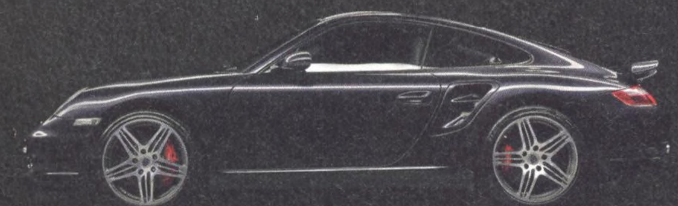
997.1 Turbo 110