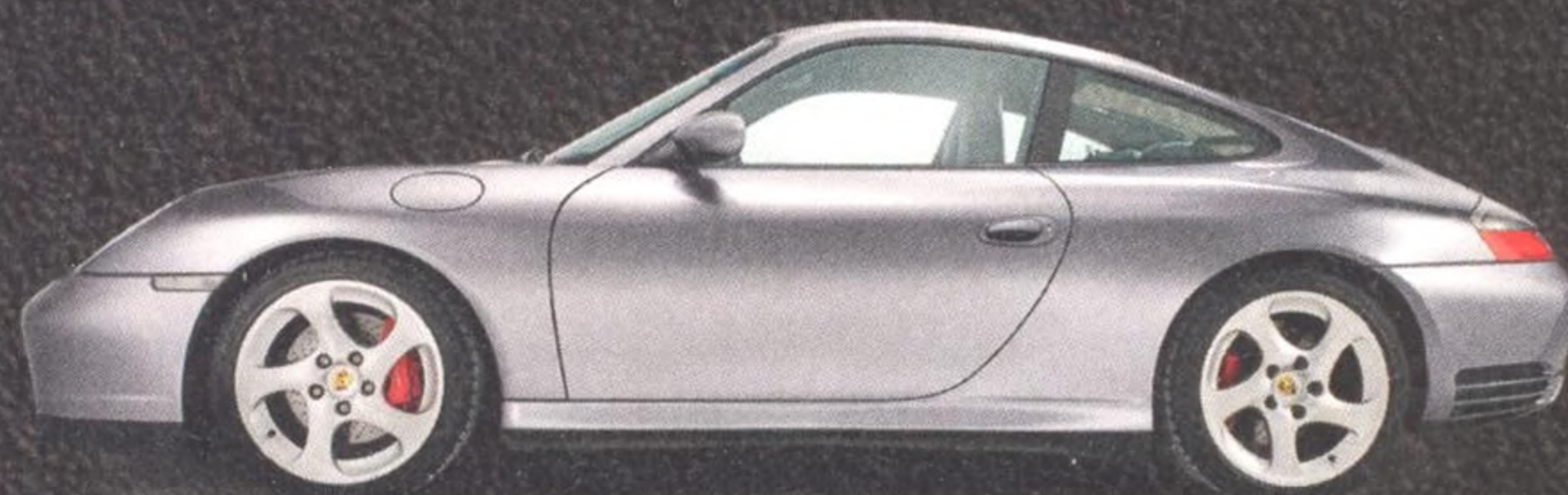
996 Carrera 4S