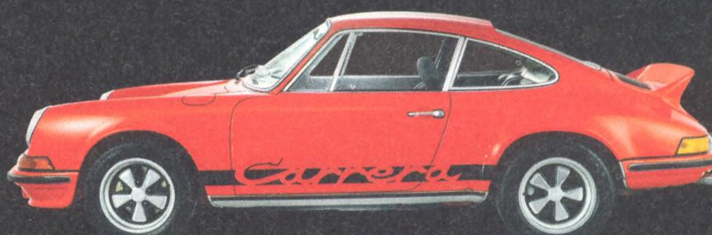
2.7 Carrera RS 120

Porsche 911 RS je jedním z nejvýkonnějších supersportovních vozů všech dob. Seznamte se s třemi nejlepšími zástupci kategorie Motorsport, od nezaměnitelného 2.7RS až po modely 993 a 991.1