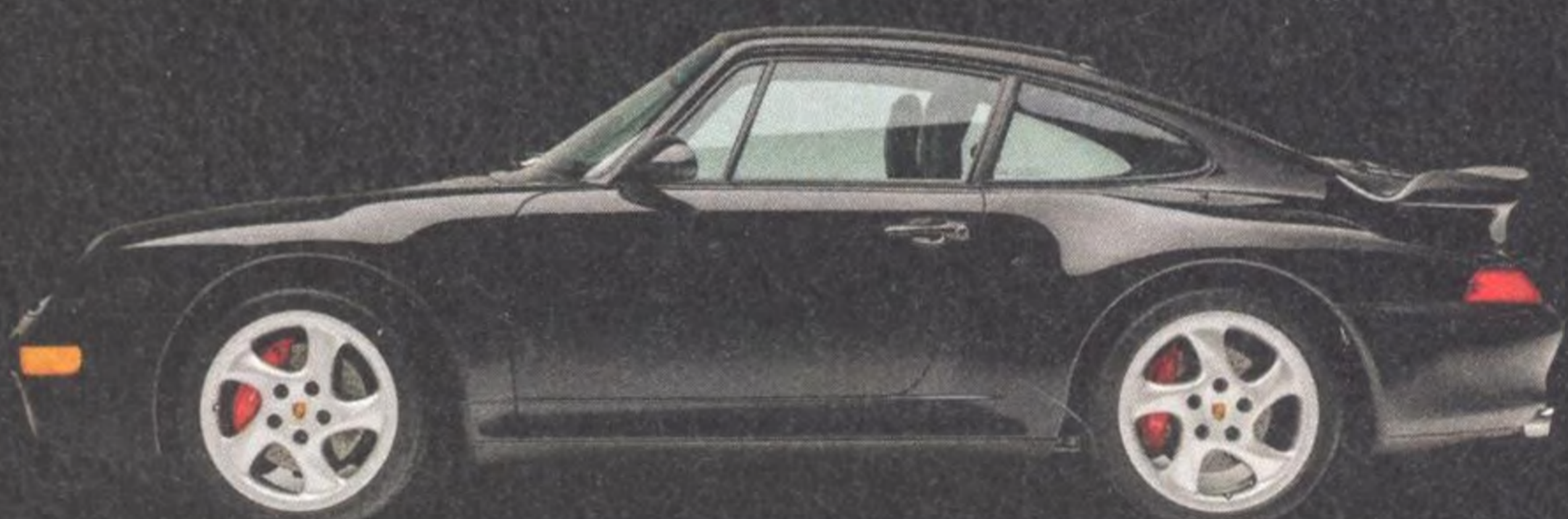
993 Turbo 102