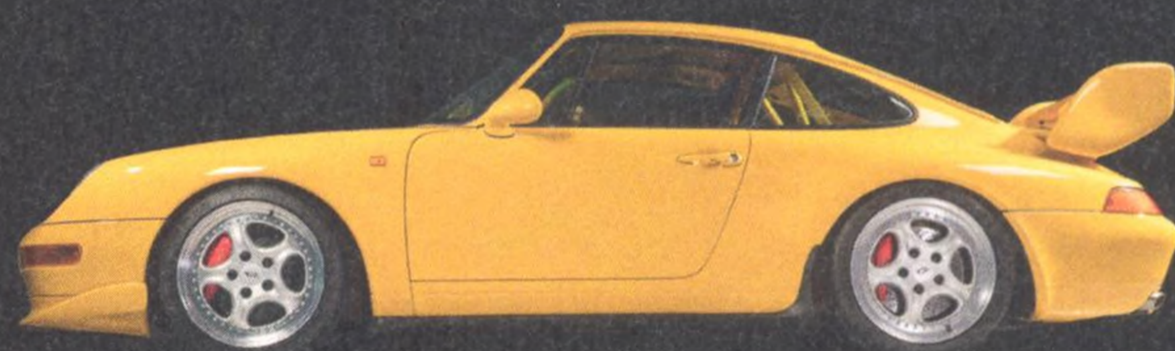
993 Carrera RS 128