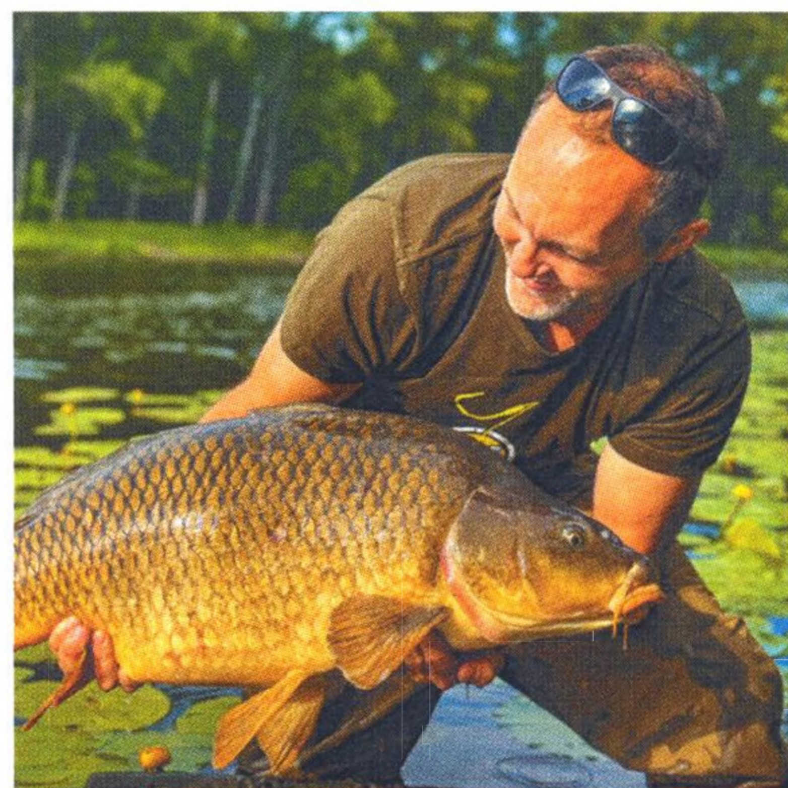
10 Labské tažení