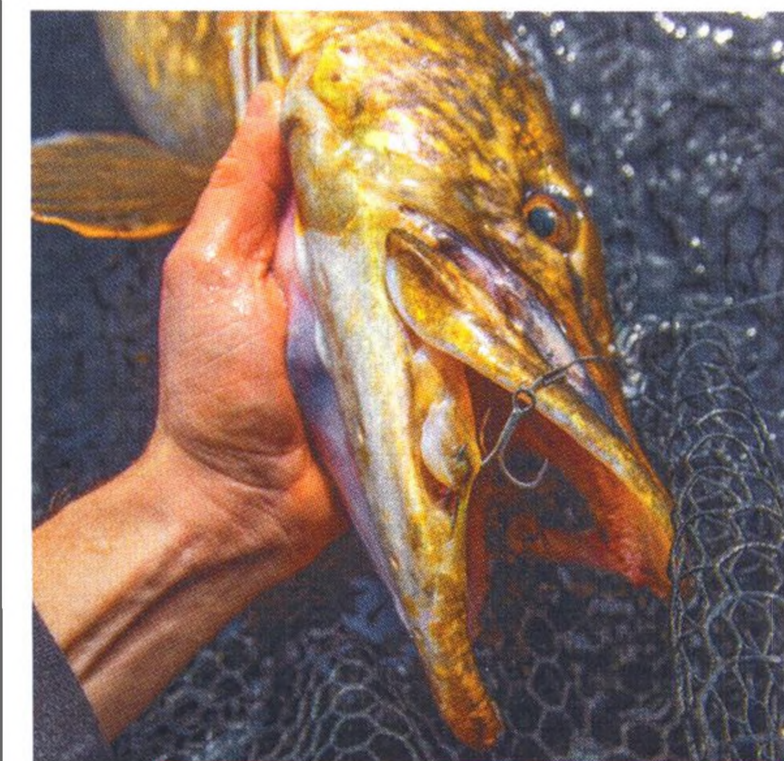
24 7 faktů o trojháčkích