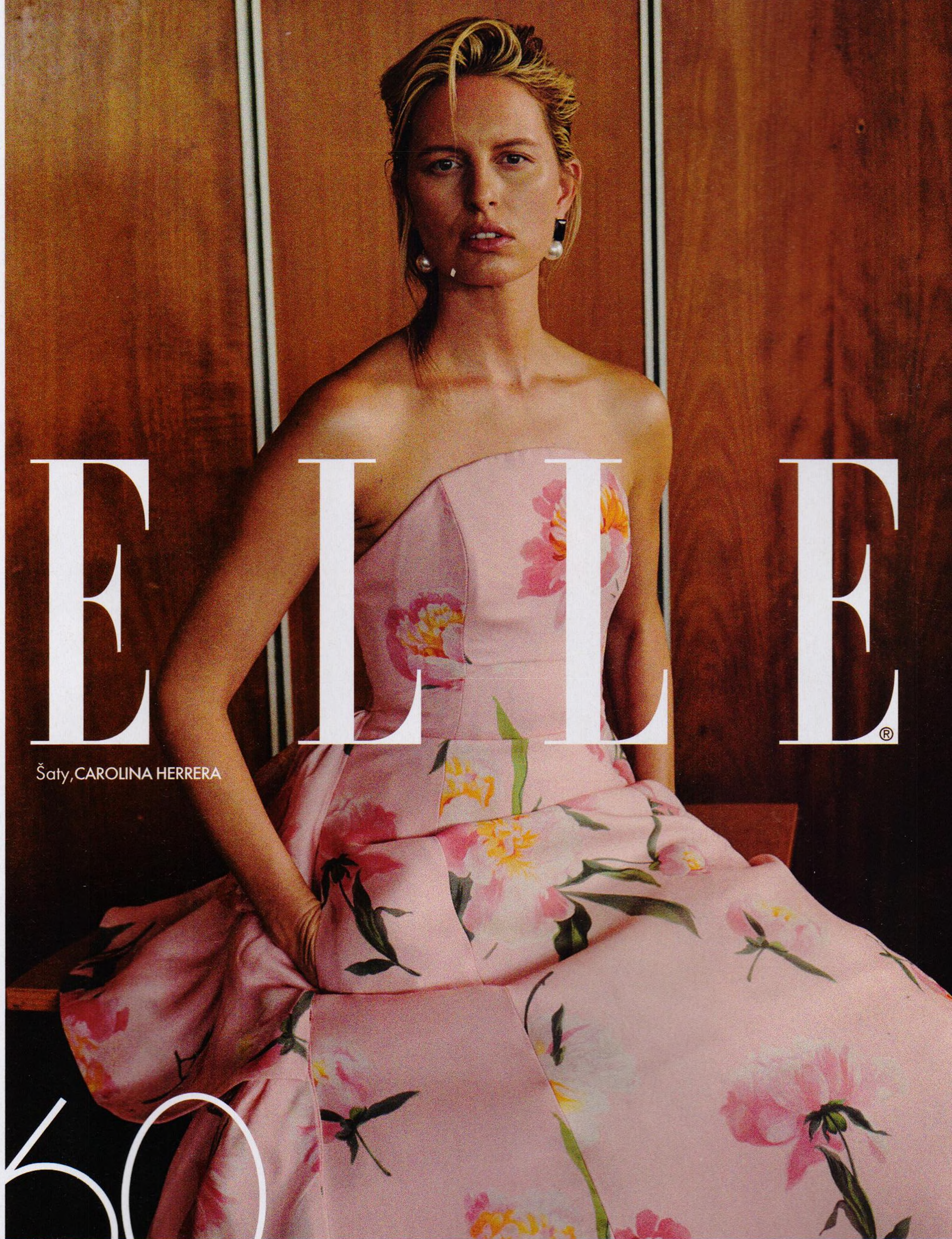
Šaty, CAROLINA HERRERA