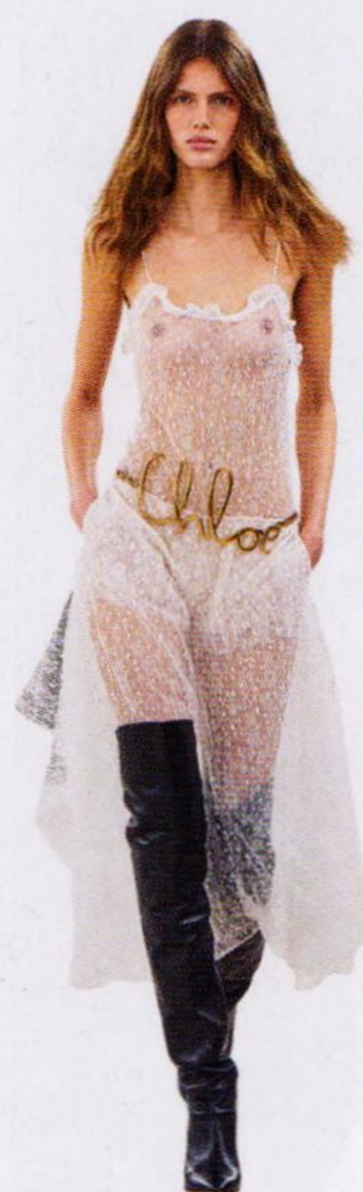
Nechat něco představitosti? We don't know her str. 16