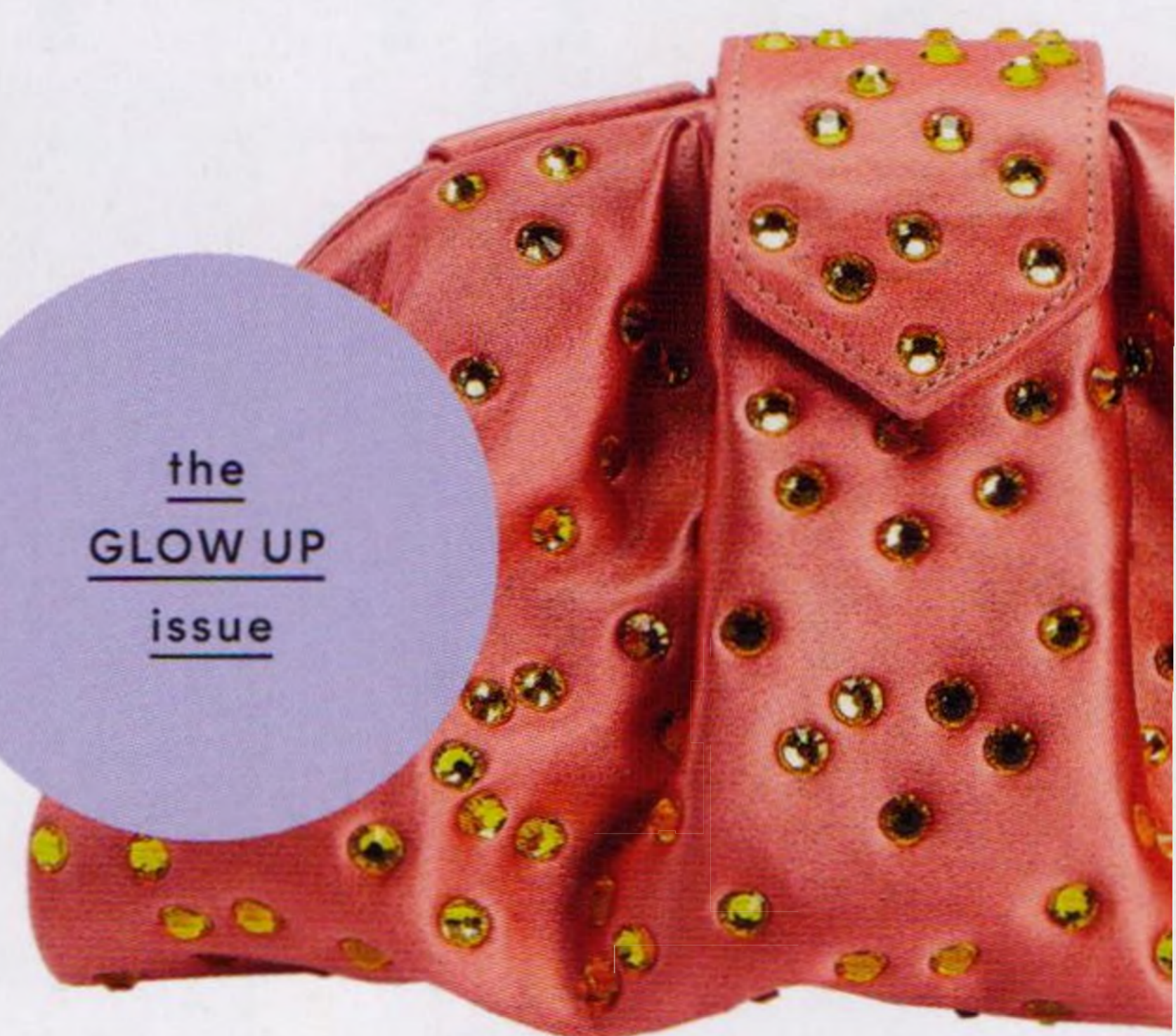
Ryanair by měl tarif Basic přejmenovat na Chic str. 29

lehce pozbyl 10 jen se na to podívejte sami 11 objekty zájmu 14 tajemství nevedeme 15 podnikatelský duch vašim nákupčím 20 luštění 22 páté roční období 24 toxoplazmóza nebude sedět v koutě 26 dělíme se o know-how 28 s dovolením vám posuneme prst na tep doby 30 obrázky 32 nová sezona, nové já 40 aby bylo jasno 44 umění zatnout drápky 50 pleť na facku 52 drákuloviny 56 koupelnová polička: okno do duše 60 čas sklizně 61 její slova žijí v našich srdcích bezplatně 70 když jsou city out of office 80 ne, že bychom snili o práci, ale... 84 jsme na stejné stránce? 86 best of gastro 88 best of astro 90 nevěrci, s.r.o. 91 dopřejte si zemětřesení o síle deseti stupňů 92 ech, vrásky z lásky 94 není čas ztrácet čas 96 to je vztahová vražda, napsala 98 sladší než apfelstrudel 100 suvenýrový little black book 102 má dáti, dal 106 oh là là 108 to je teda maso 110 bizár na konec 114