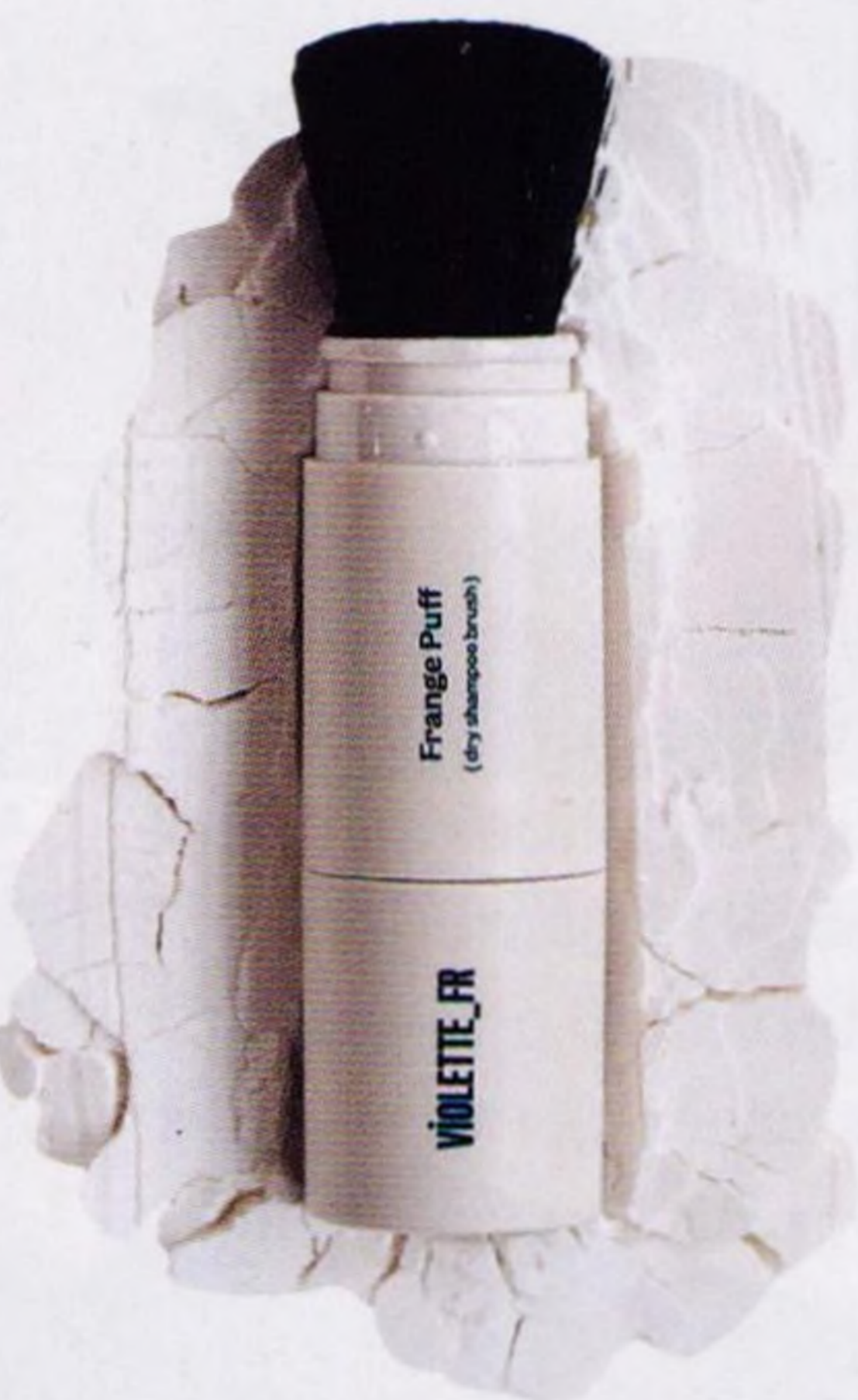
Období sucha, jaké si zamilujete str. 61