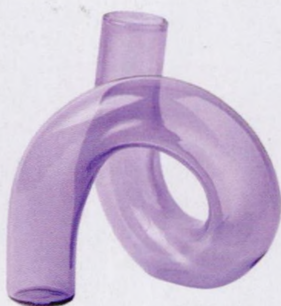
Omg, to je fakt trubka str. 113