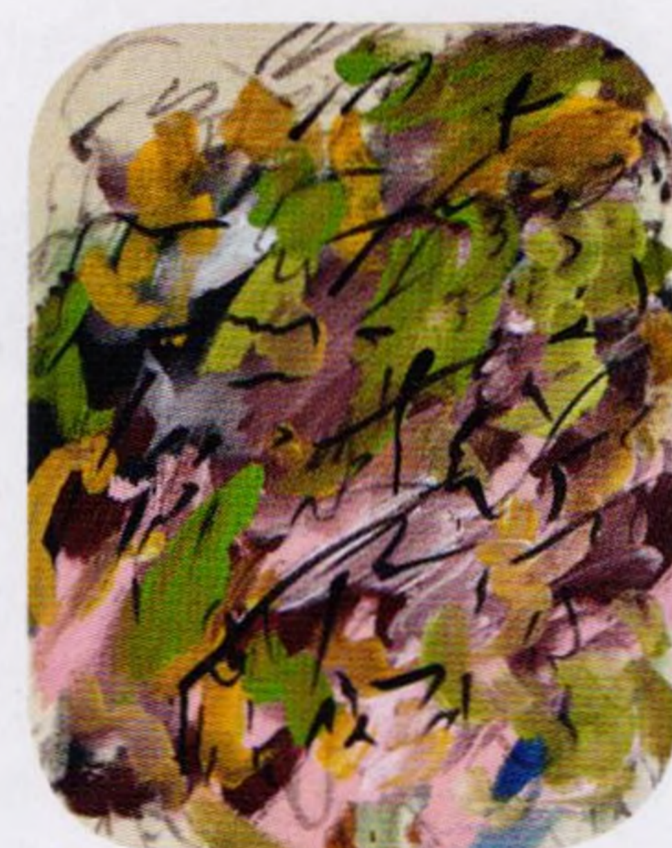
Co se zase děje str. 8