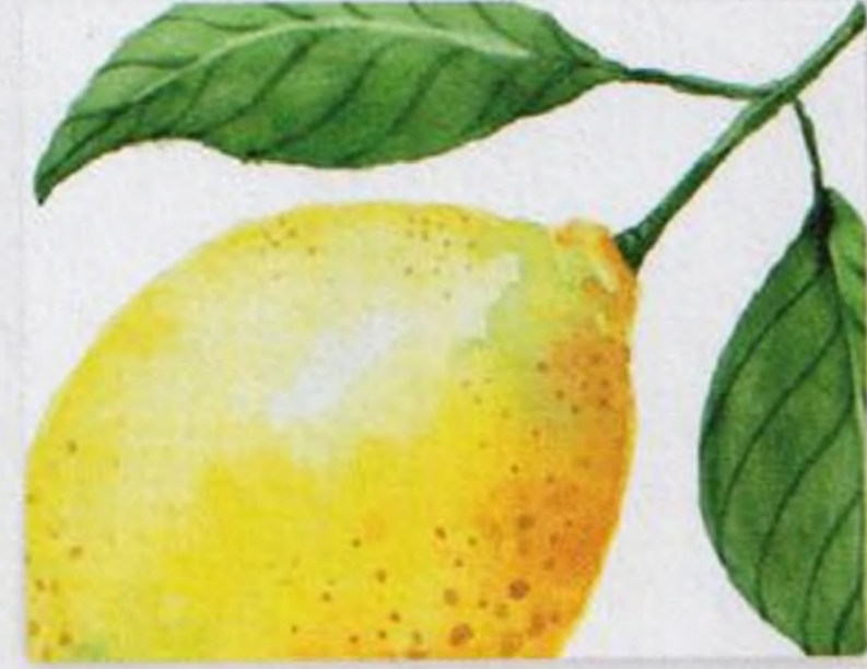
114 | Citron