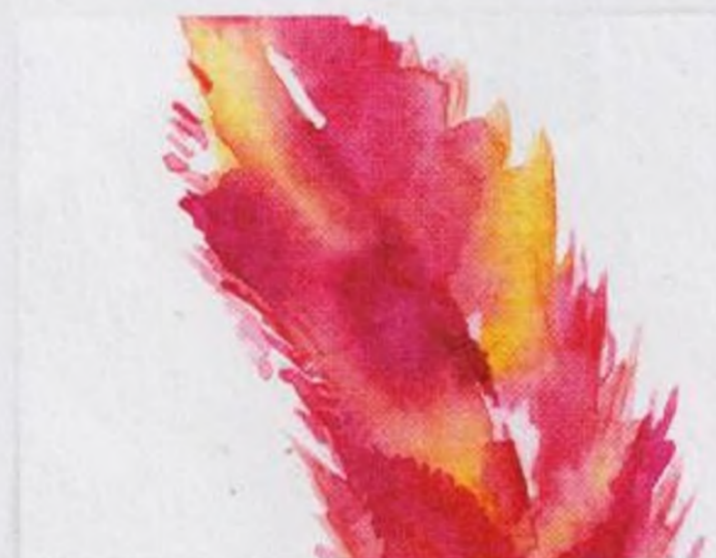
72 | Pírko