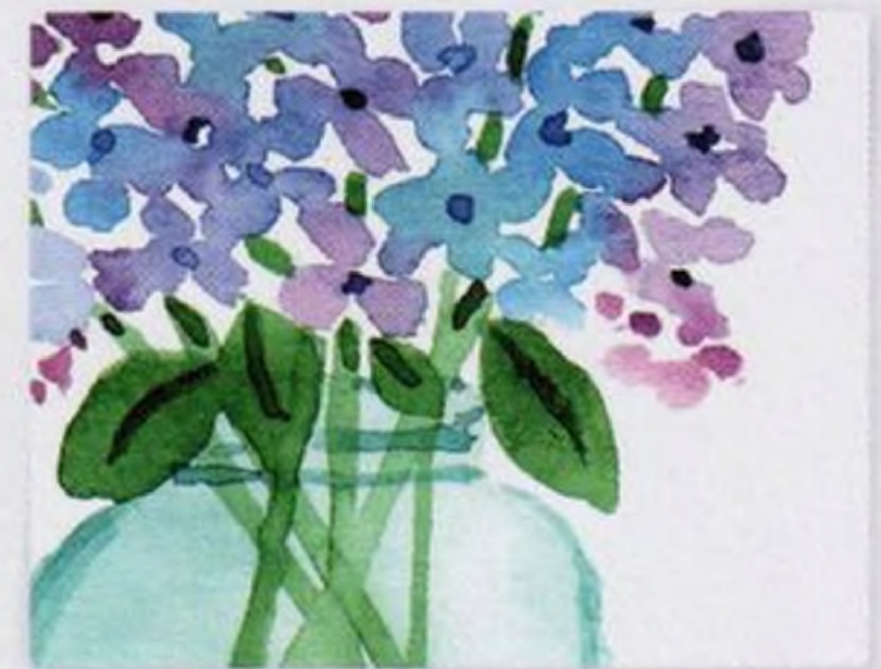
38 | Květiny ve sklenici