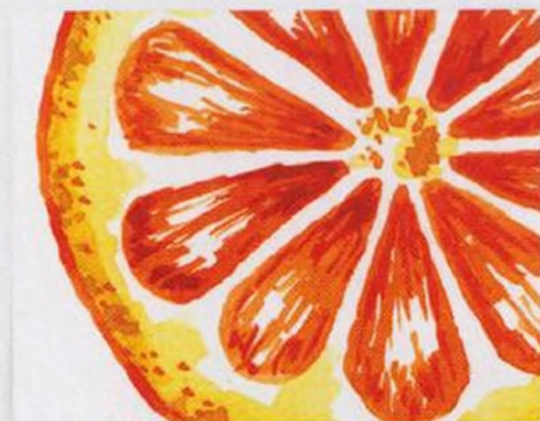
66 | Pomeranč