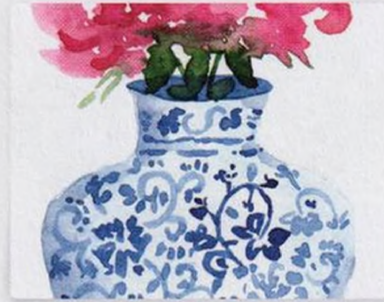
84 | Čínská váza