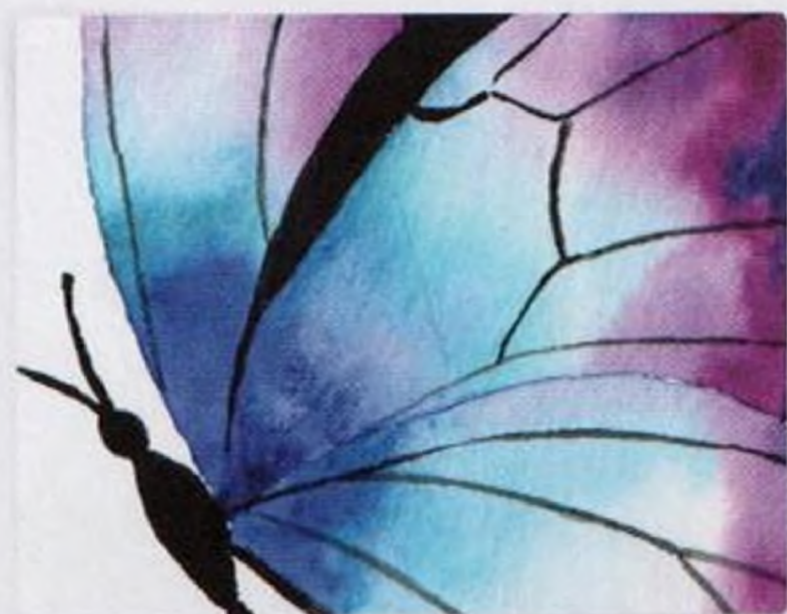
60 | Motýl