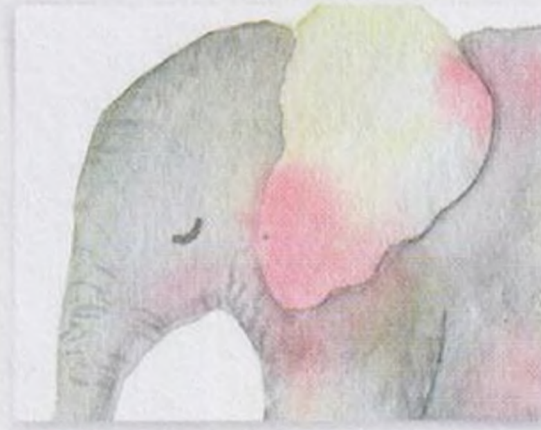
78 | Slon