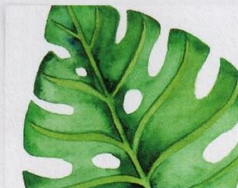
102 | Monstera