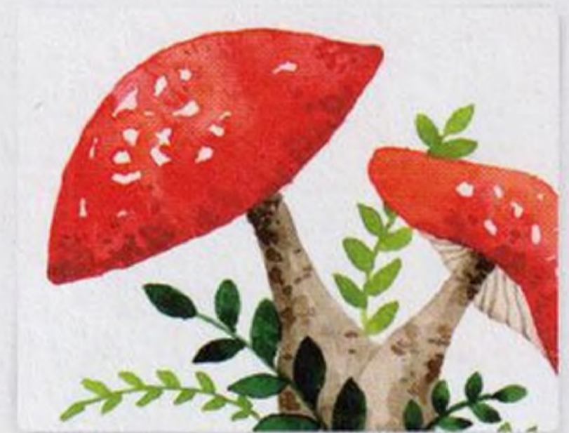
92 | Muchomůrky