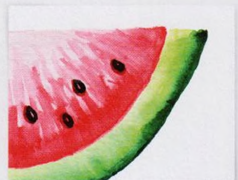
44 | Vodní meloun