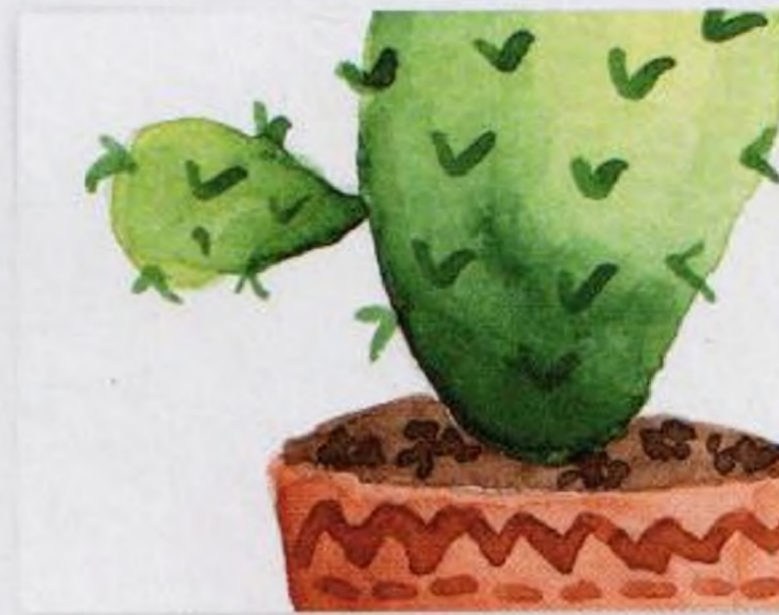
56 | Kaktus v květináči