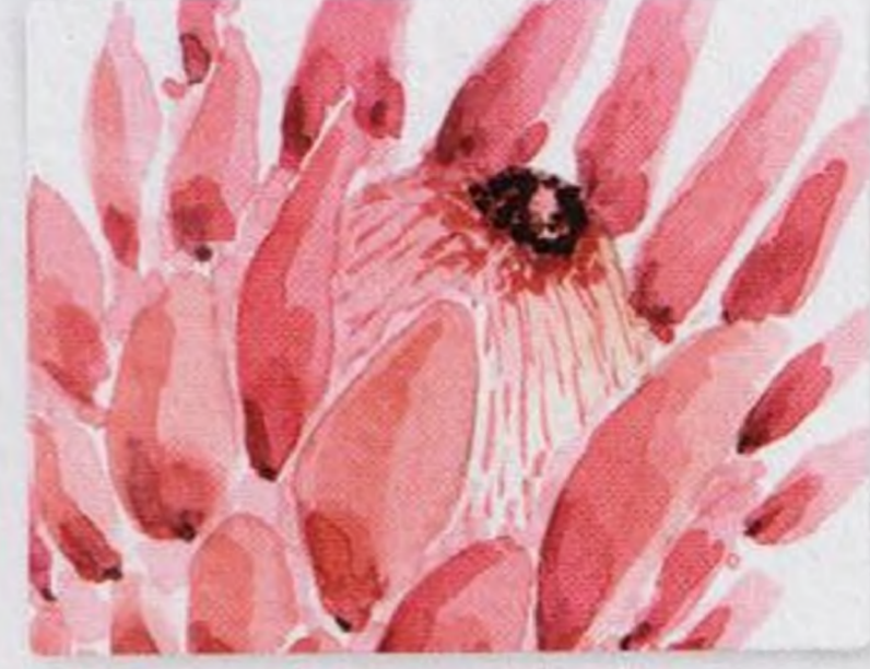
116 | Protea