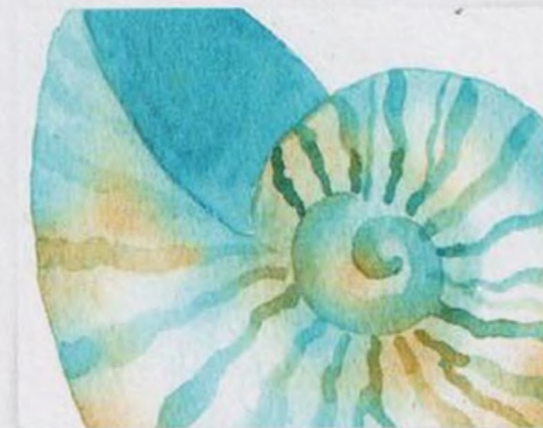
74 | Ulita