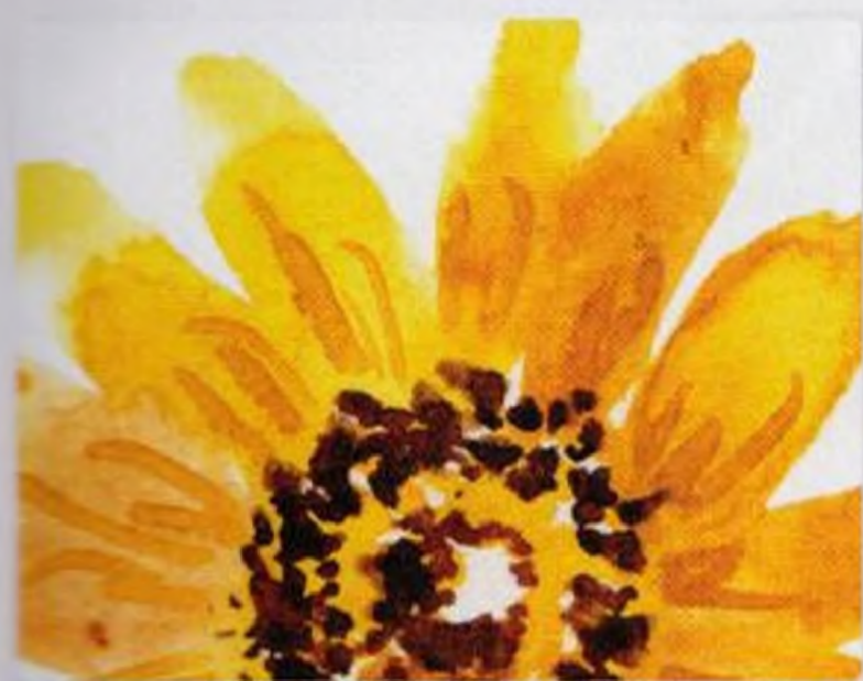
46 | Slunečnice