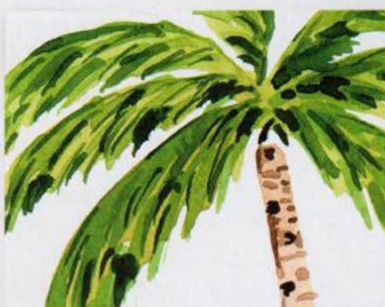
40 | Palma