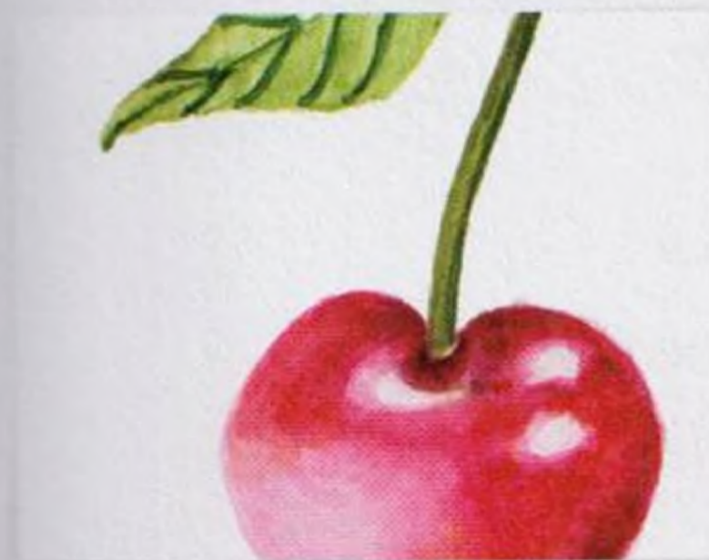
118 | Třešeň