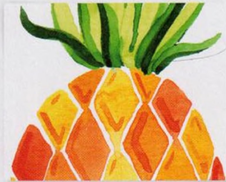
30 | Ananas