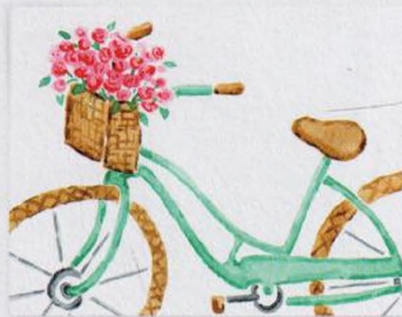
90 | Stylové kolo