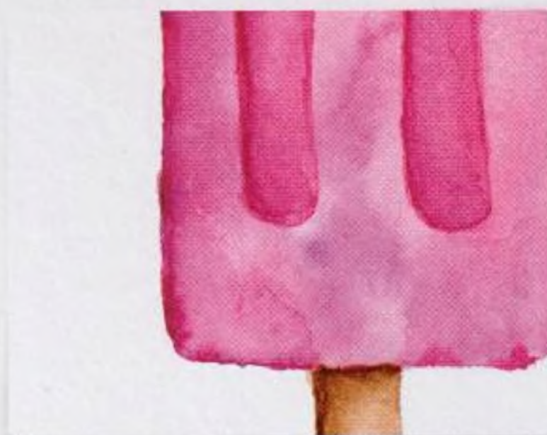
34 | Nanuk