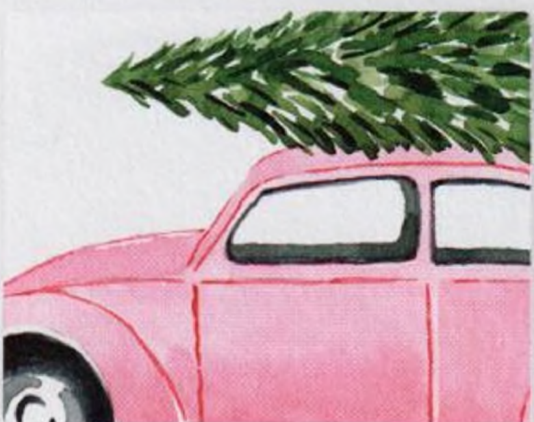
100 | Sváteční auto