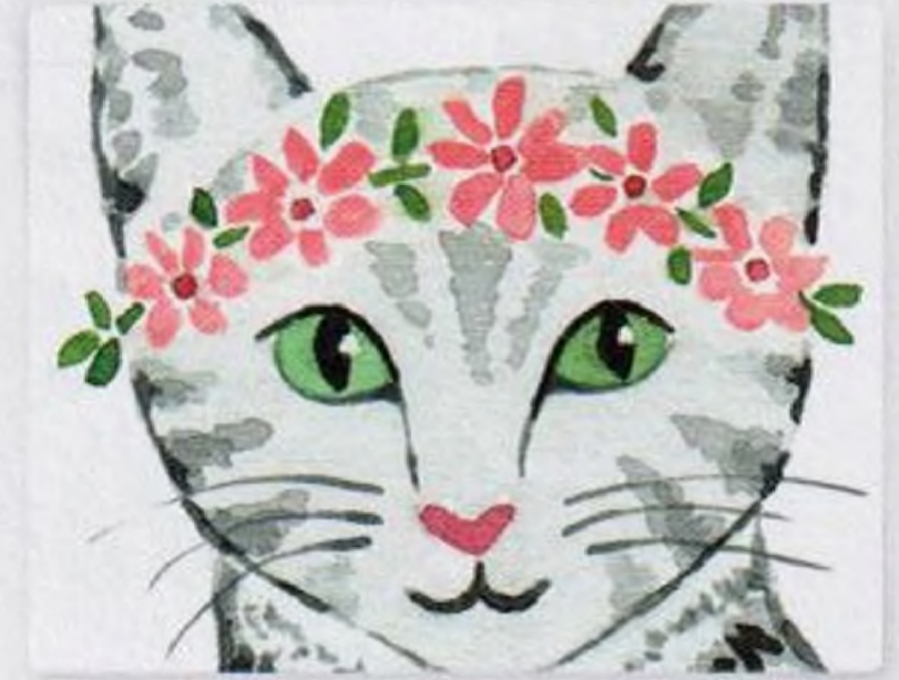
86 | Kočka