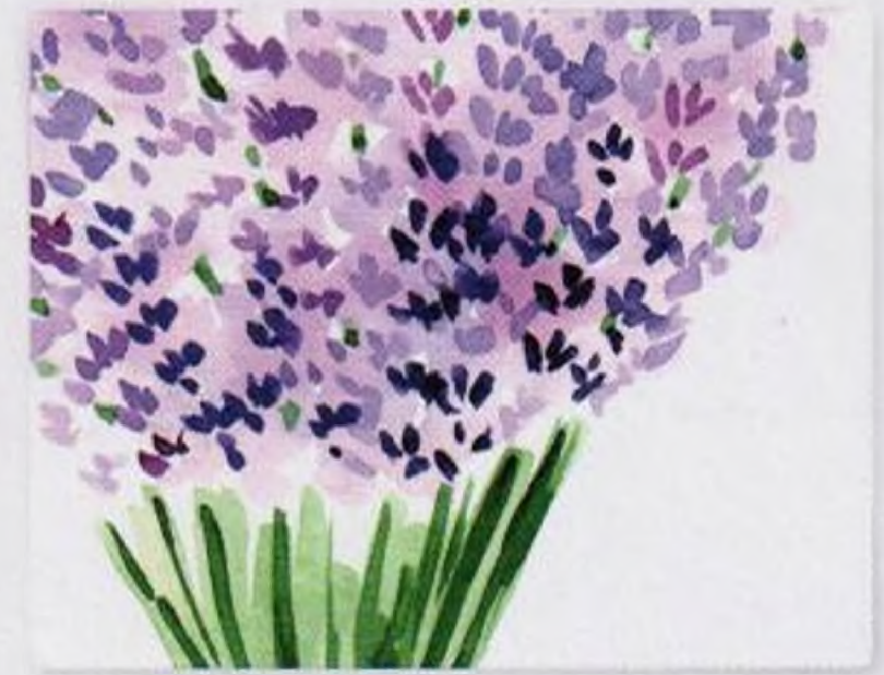
32 | Levandule