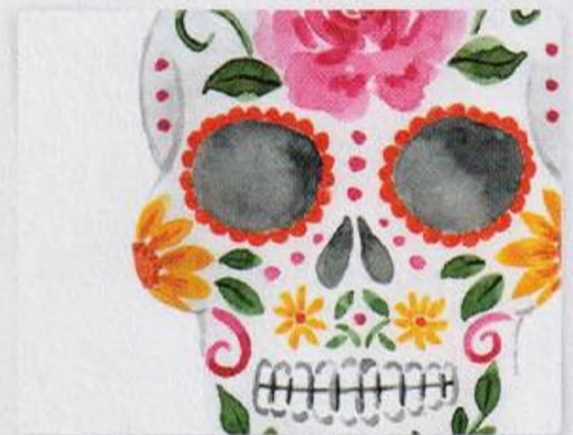
98 | Den mrtvých