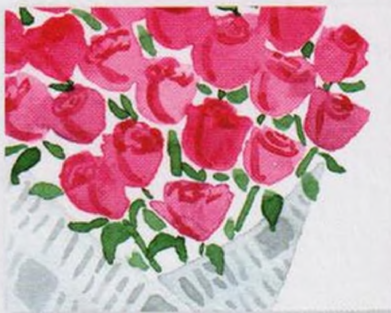
28 | Kytice v novinách