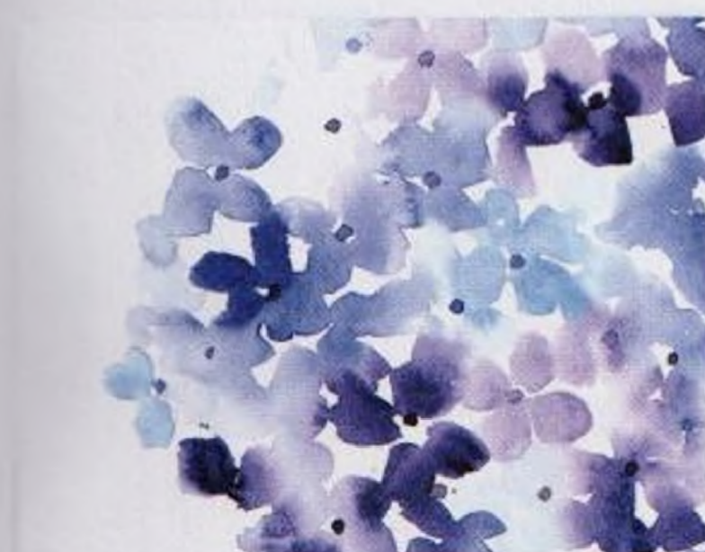
70 | Hortenzie