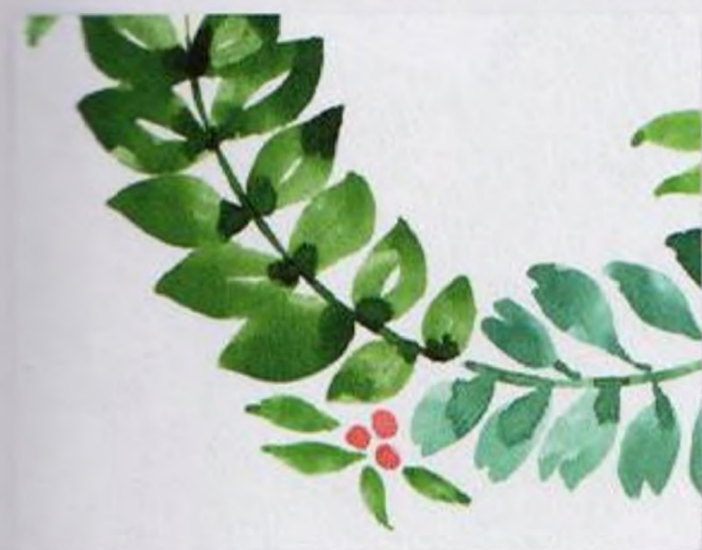
52 | Věvec