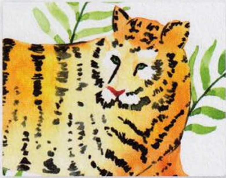
82 | Tygr