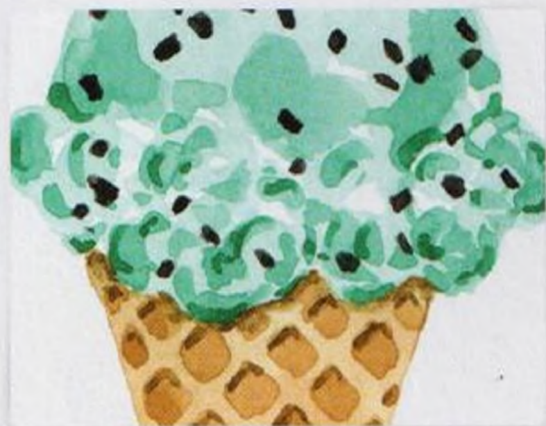
54 | Zmrzlina