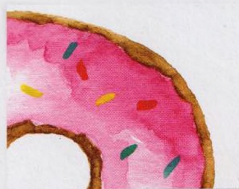
68 | Donut