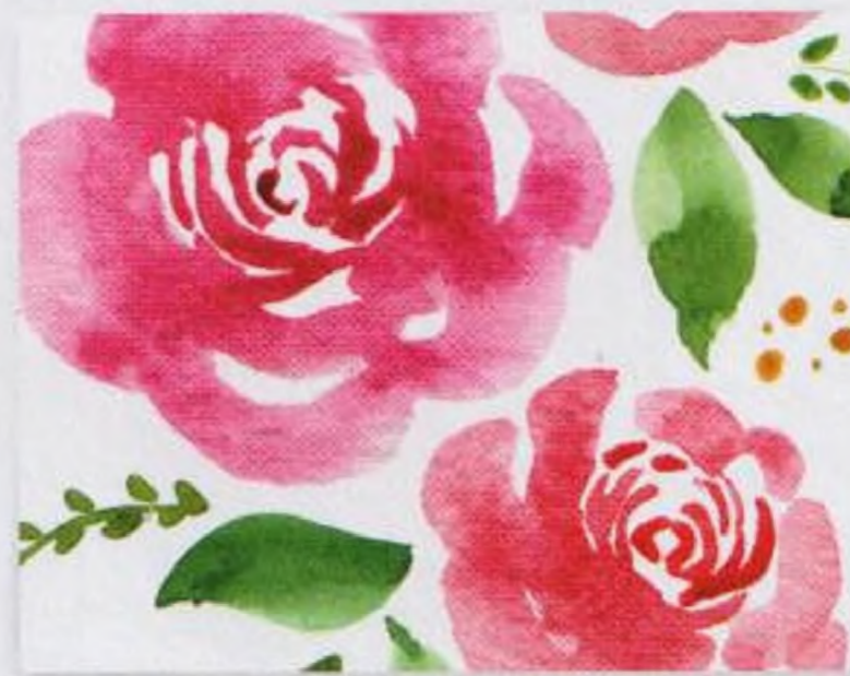
50 | Růže