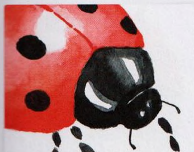
58 | Beruška