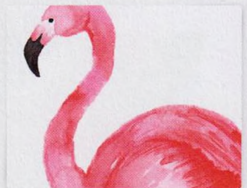
104 | Plameňák