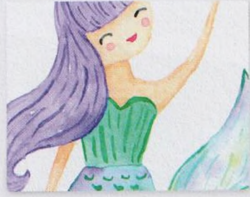
110 | Mořská panna