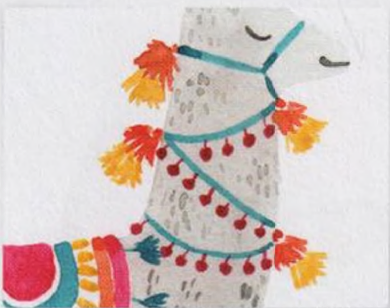
94 | Lama