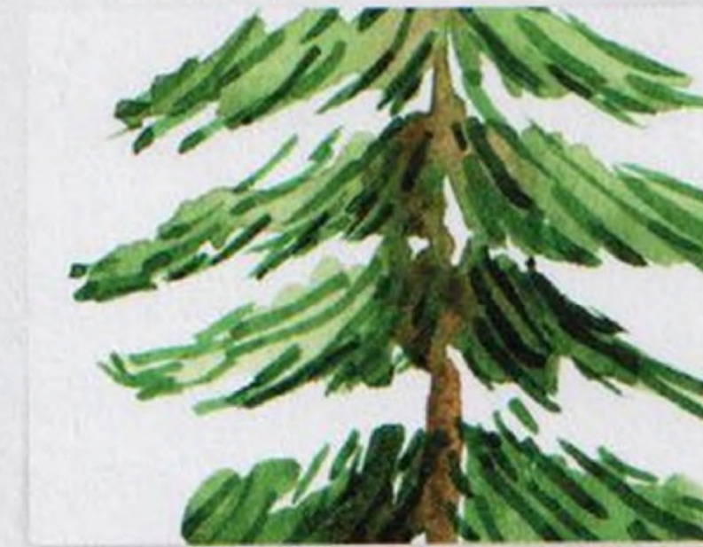
124 | Vánoční strom