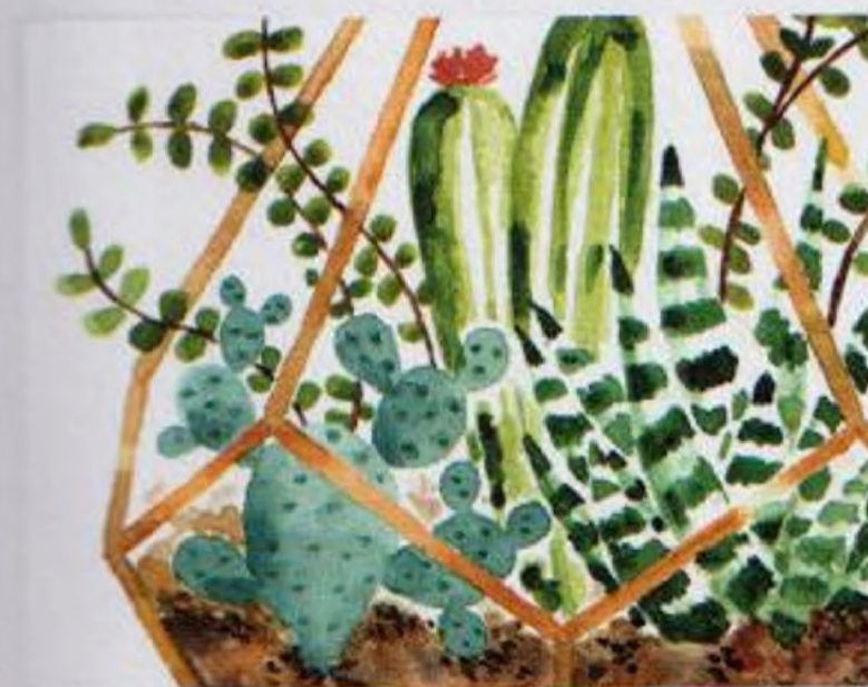
122 | Florárium