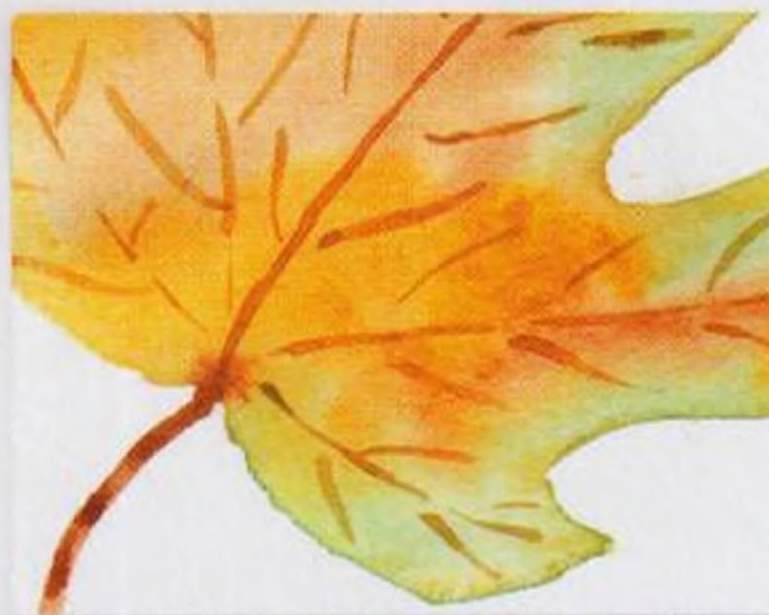
36 | Podzimní listí