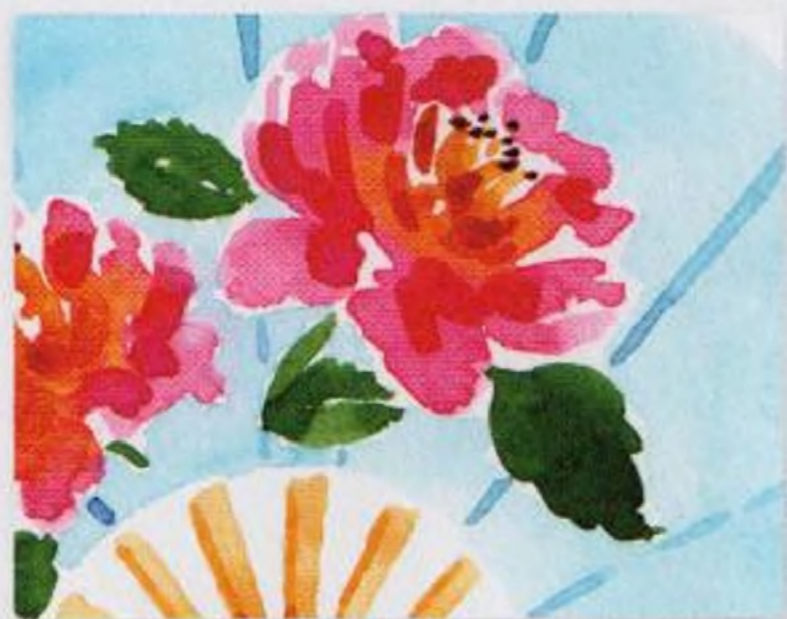
48 | Hedvábný vějíř