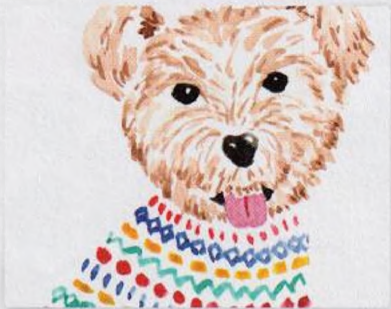
88 | Pes