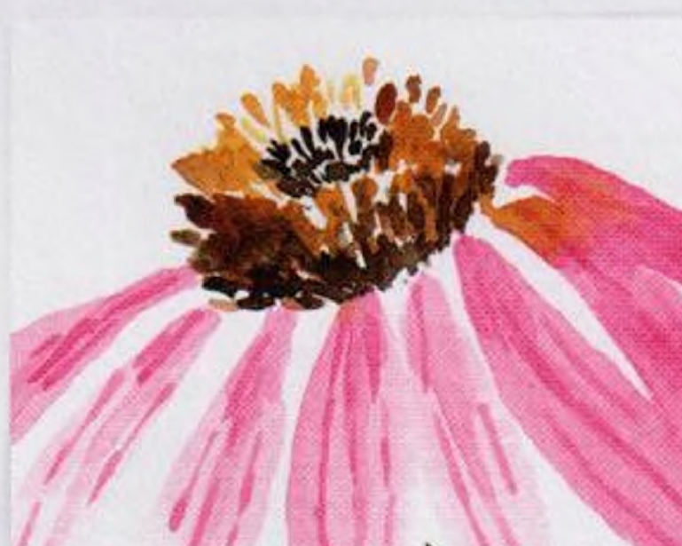
42 | Echinacea