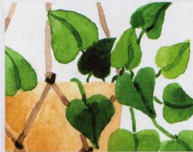
62 | Závěsná rostlina