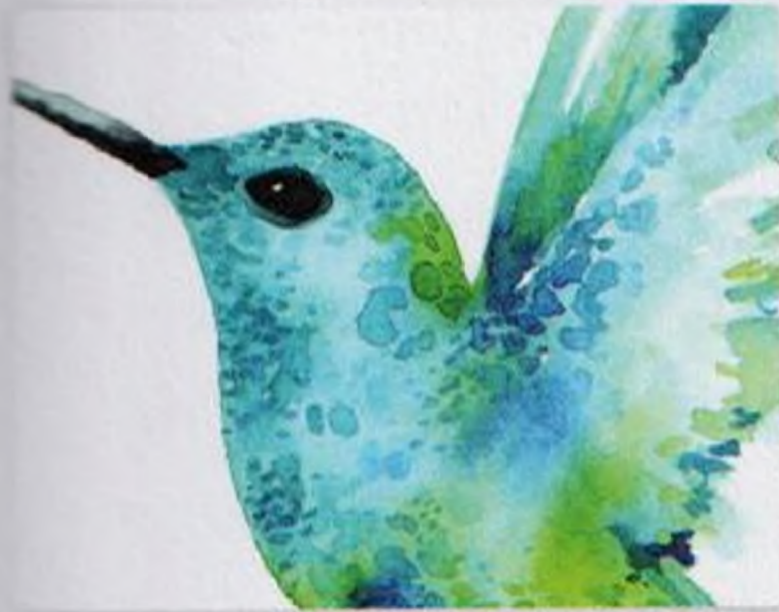
112 | Kolibřík