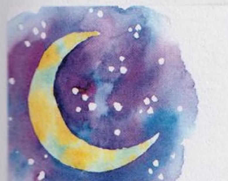
126 | Srpek měsíce