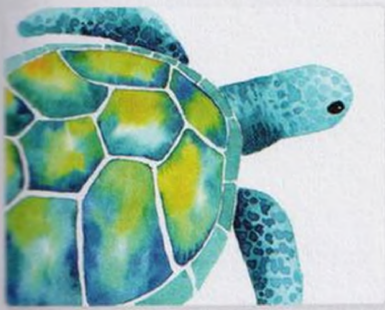
106 | Mořská želva