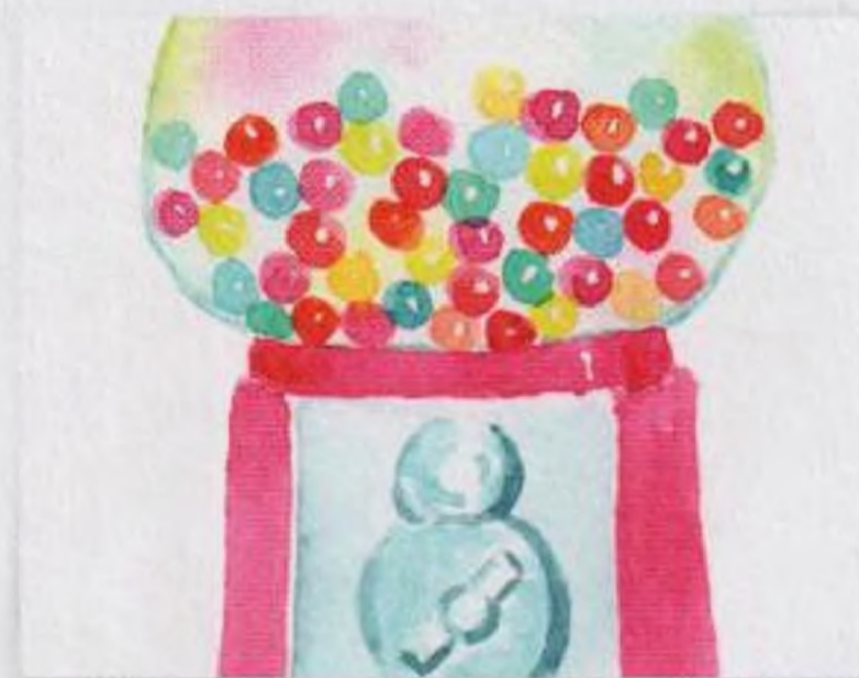
96 | Automat na žvýkačky