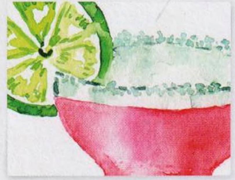
80 | Margarita