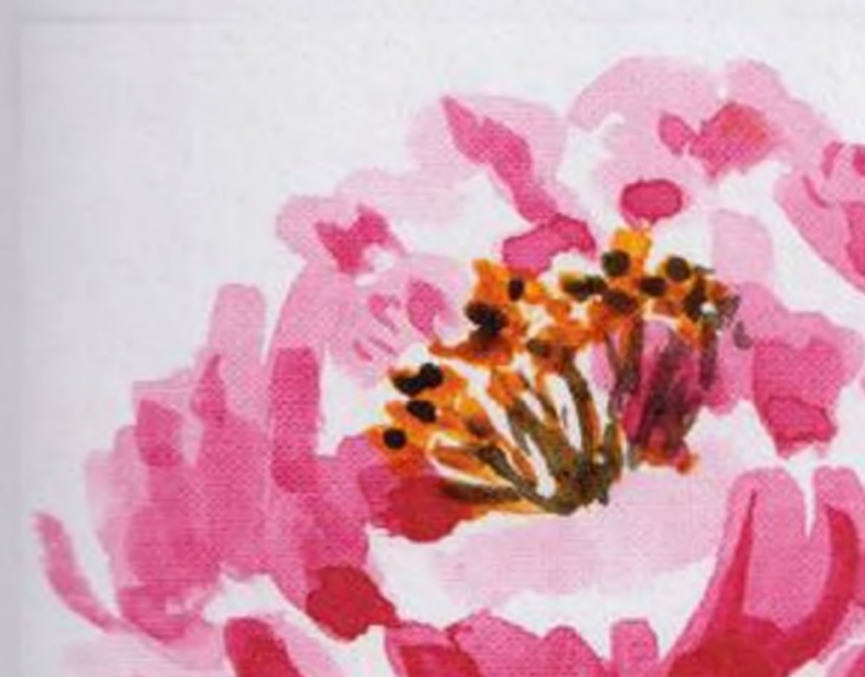
64 | Divoká růže