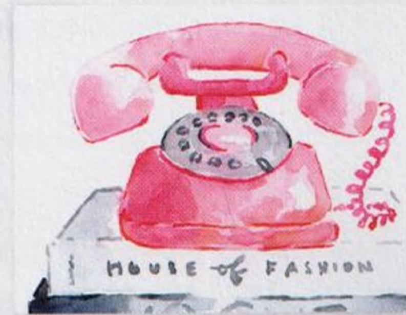
120 | Retro telefon