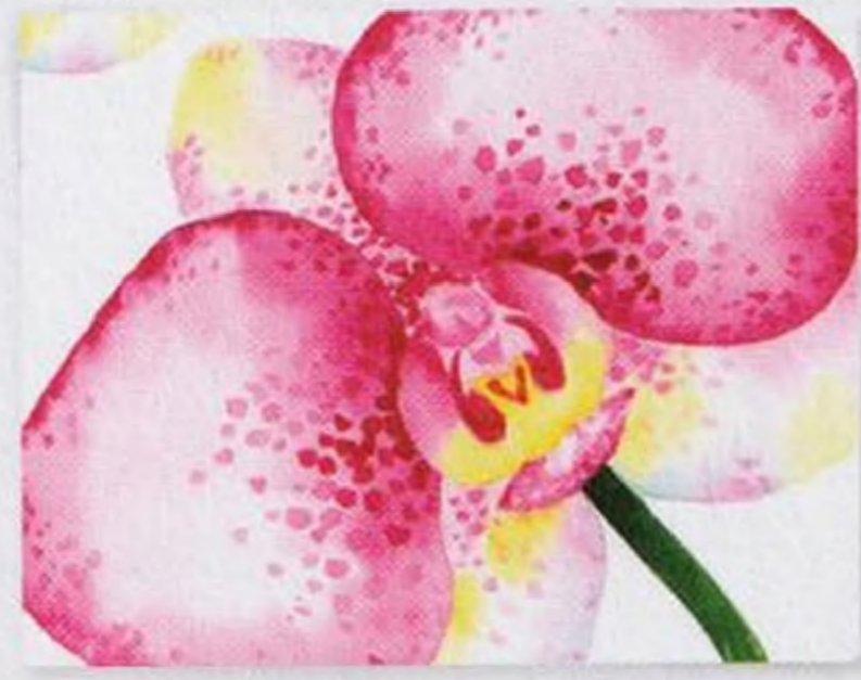
108 | Orchidej