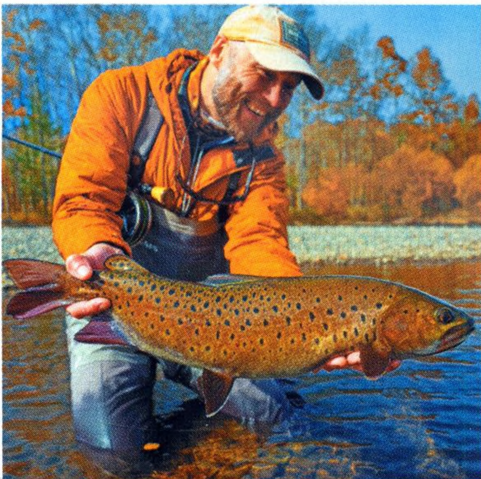
04 Mongolská cesta aneb křehké putování v čase