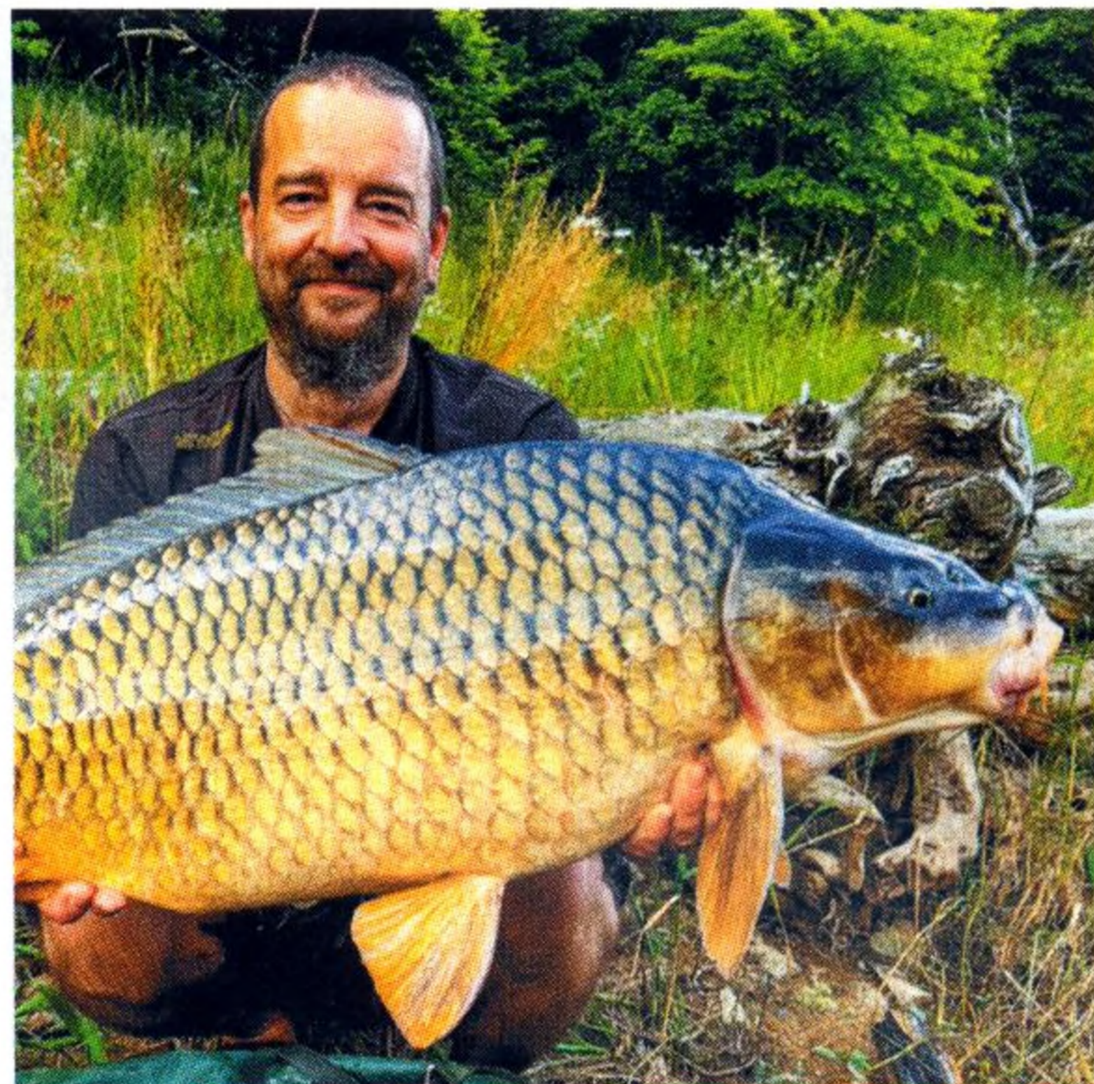
14 Přehradní výzva