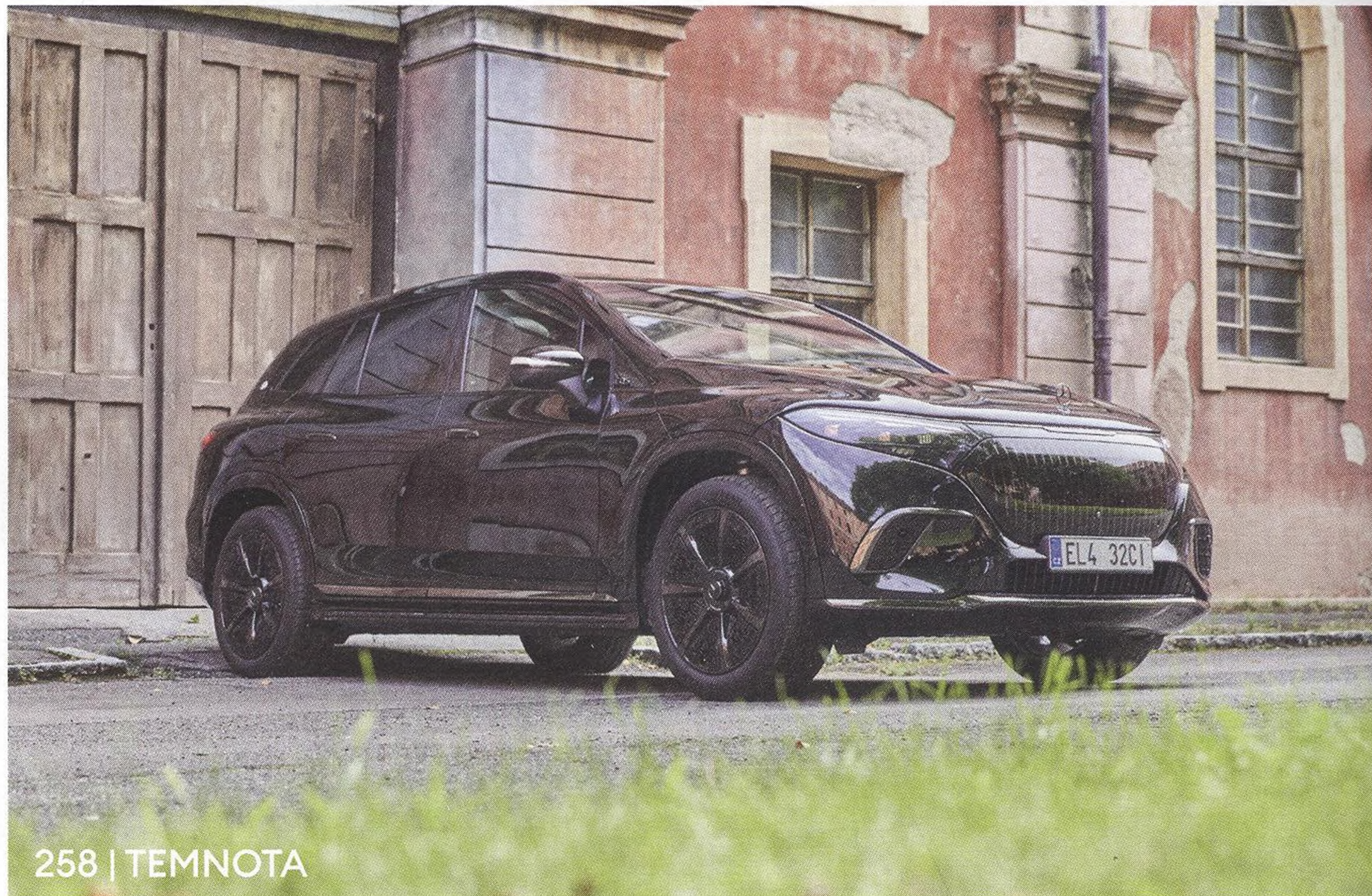
258 | TEMNOTA