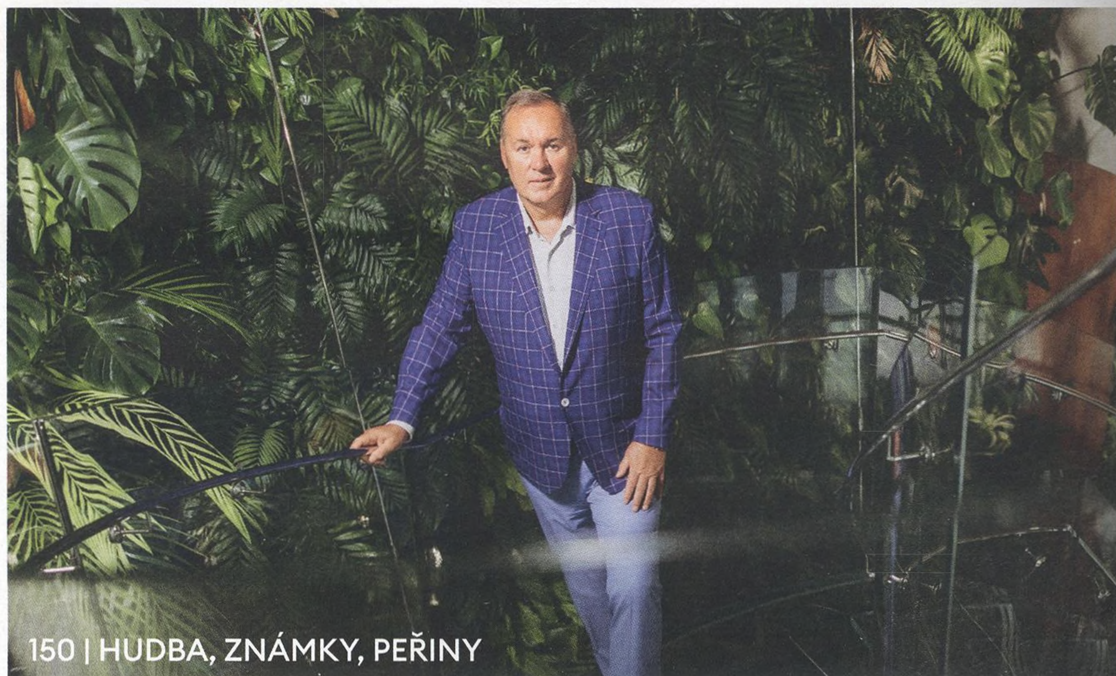
150 | HUDBA, ZNÁMKY, PEŘINY