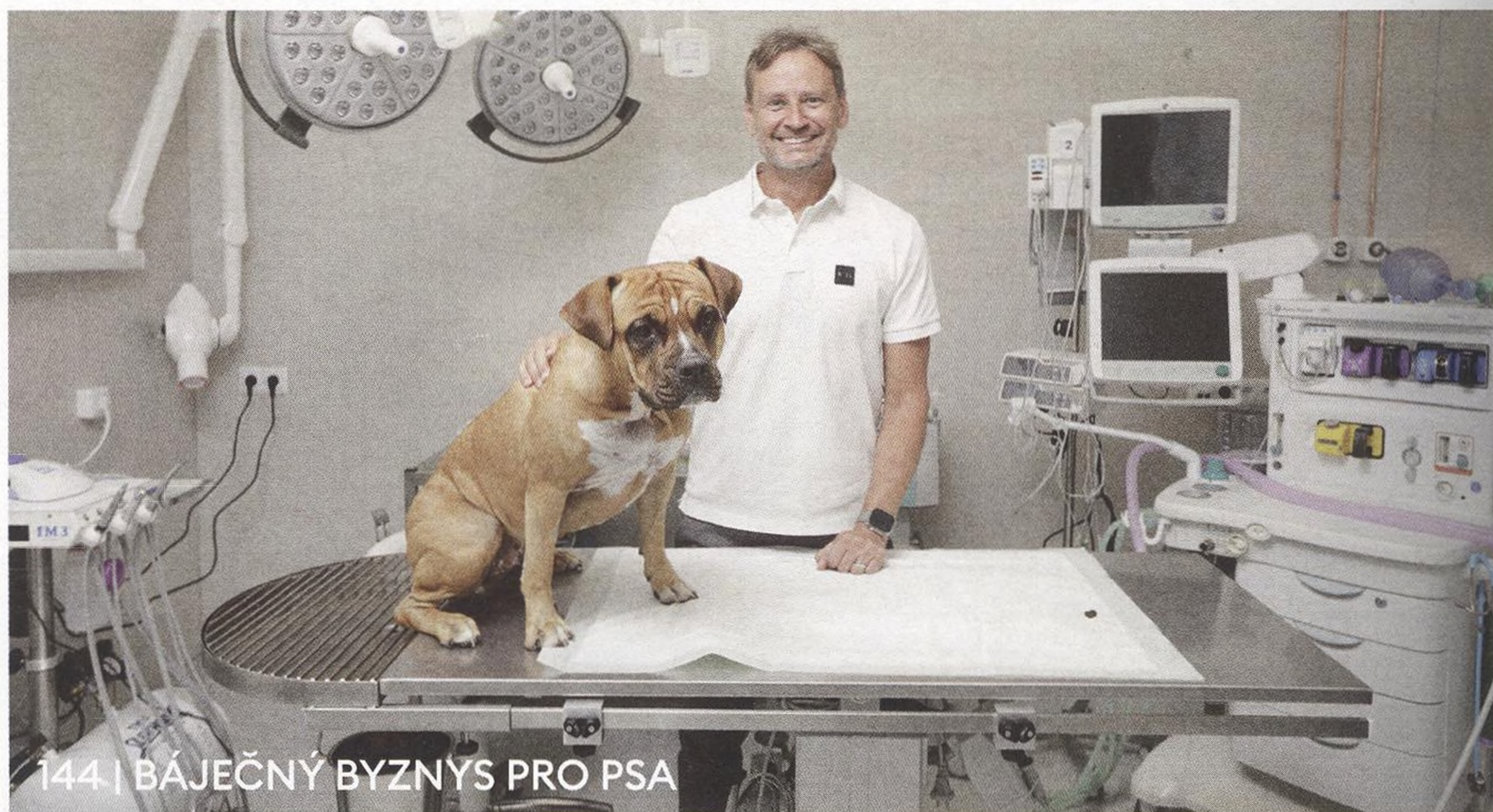
144 | BÁJEČNÝ BYZNYS PRO PSA