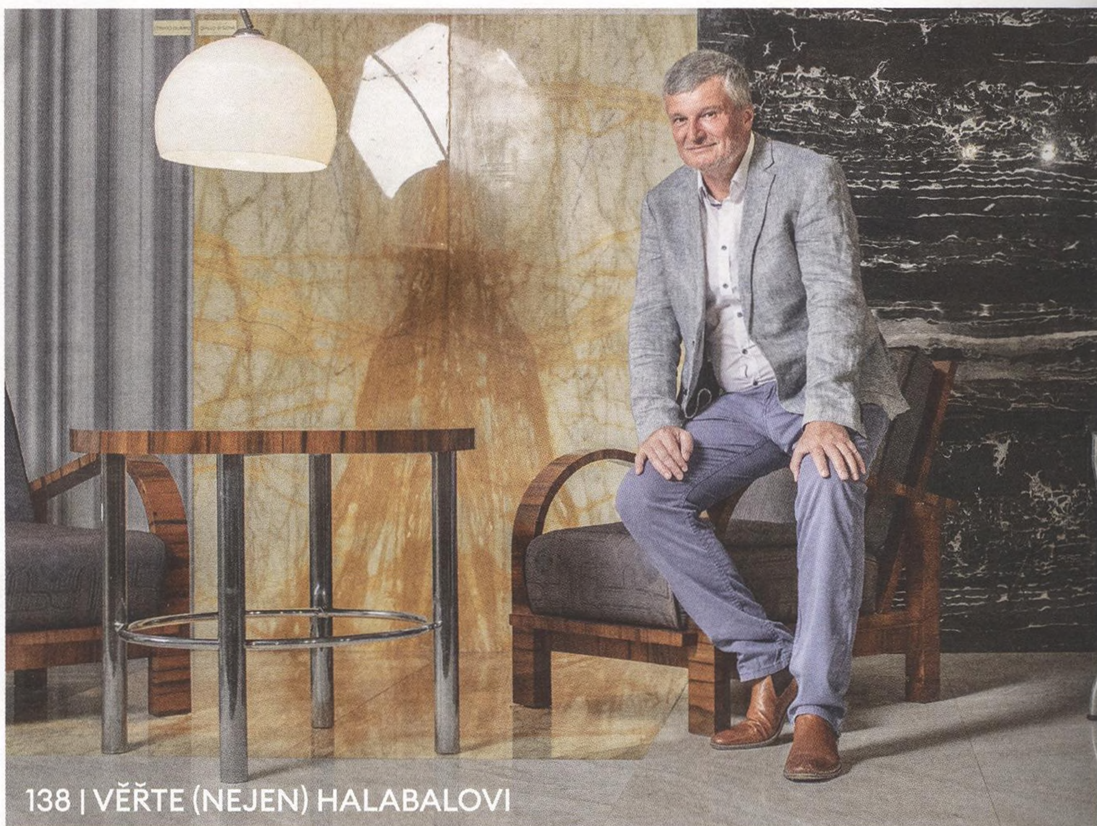
138 | VĚŘTE (NEJEN) HALABALOVI