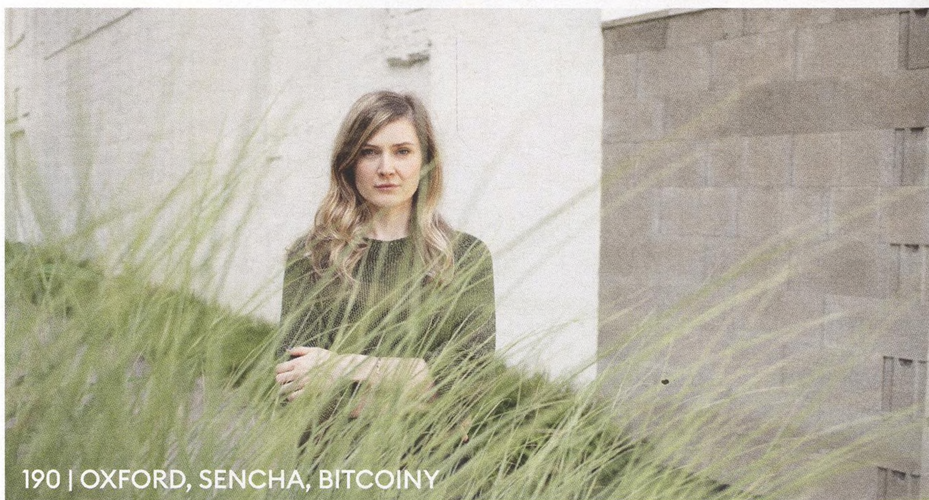
190 | OXFORD, SENCHA, BITCOINY