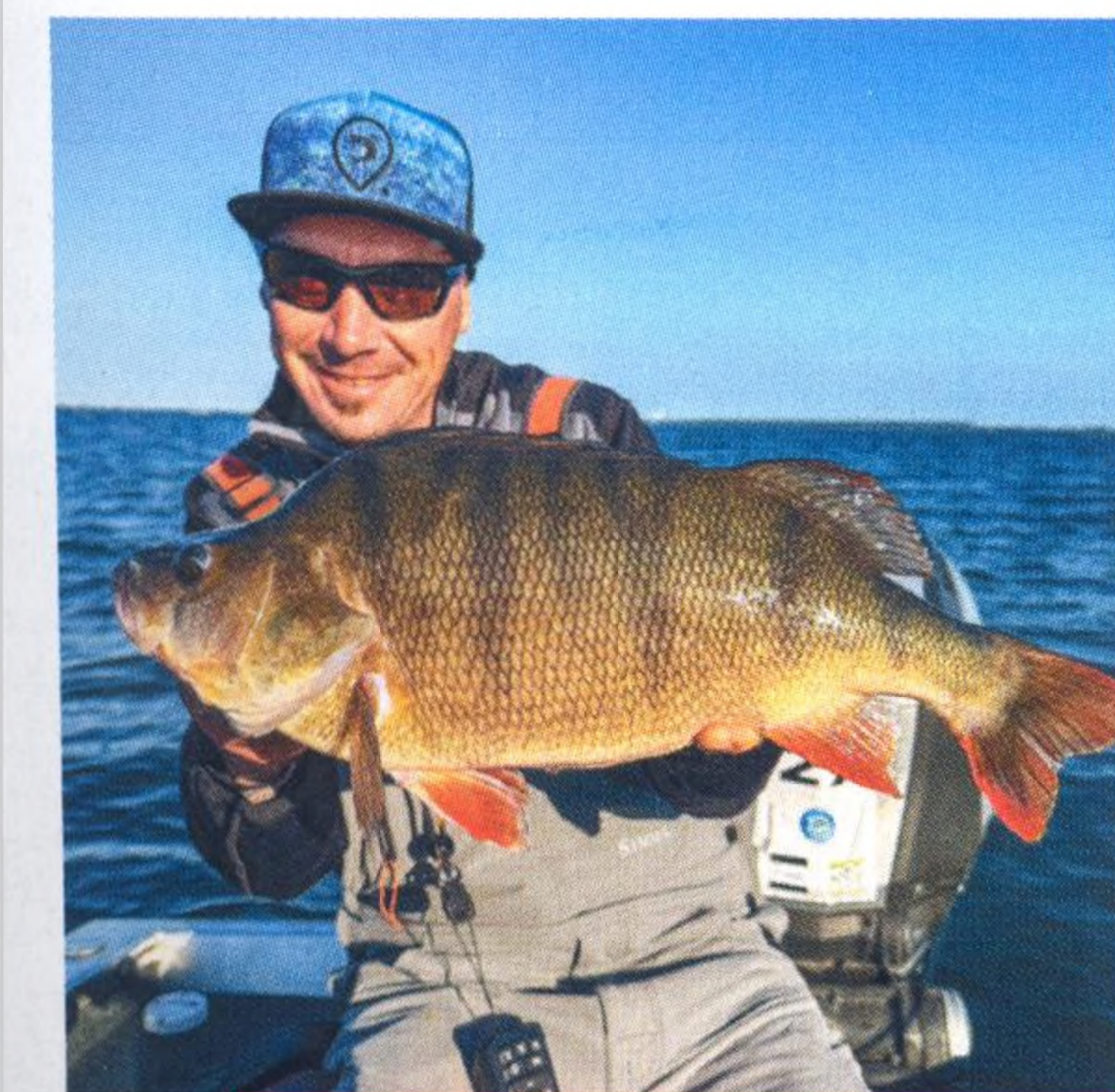
22 World Predator Classic 2024 Champions