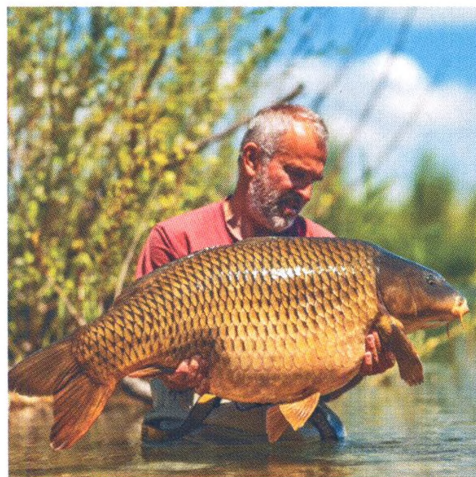
18 Crystal Lake