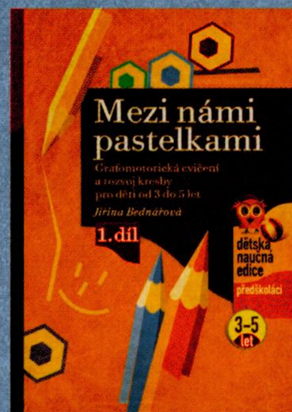
Jiřina Bednářová Mezi námi pastelkami

Další knihy k rozvoji dítěte ve věku od 3 do 5 let: