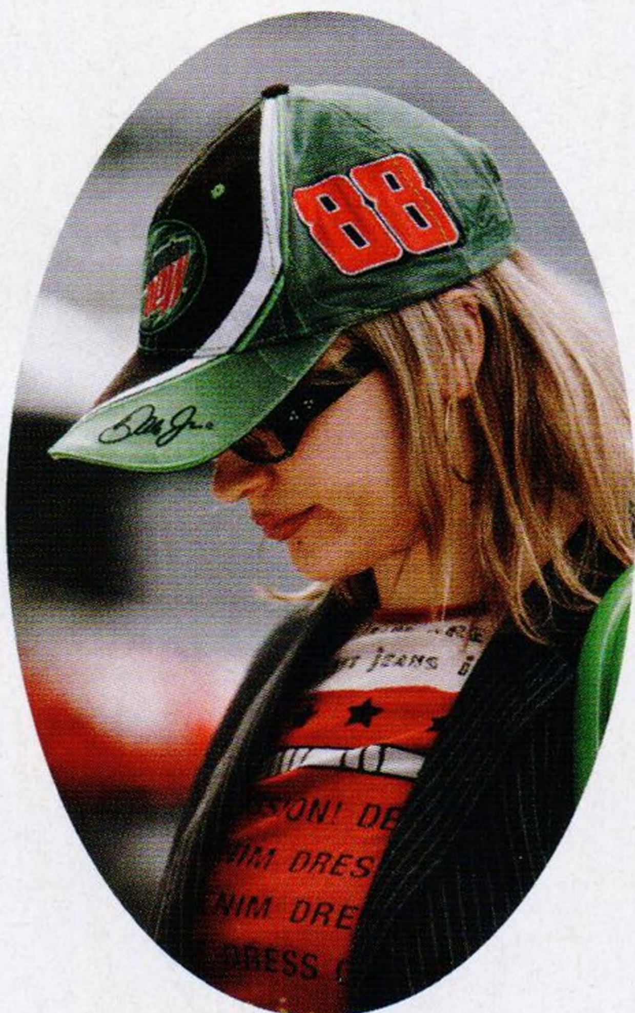
Bez čepice nejde mít pod čepicí str. 28

tohle si nemůžete nechat ujít 12 kudy ven z bludných kruhů (pod očima) 18 co se nám teď honí hlavou 20 za oponou 22 analýza osobitého stylu 30 barva, co vám objedná martini 32 módní cheaty 33 vaše druhá kůže 38 boj doplňků o zápěstí 40 žádné epi epí epičky od nás nečekejte 52 klid, tohle je jenom na oko 62 sbohem, holé neštěstí 64 mamánek jeden 67 zahřálo 68 míří vysoko, hodně bude někde 72 čeho je moc, toho je příliš 80 to je hlína (a sklo) 84 ta teda vyhrává 86 co si teď vyčítáme 88 pro nedočkavé 90 čas, co vám nikdo nevrátí 92 doba je zlá, už randíme i se ženatými 96 a pak že náhoda je blbec 98 otevírání hrobů 100 už jsme zase pod vlivem (atmosféry) 102 pojišťovna štěstí 106 zastavit stát raz dva 108 cukr je prý nový pervitin, ale no stress 110 reklama na ticho 111 extra porce podivností 114