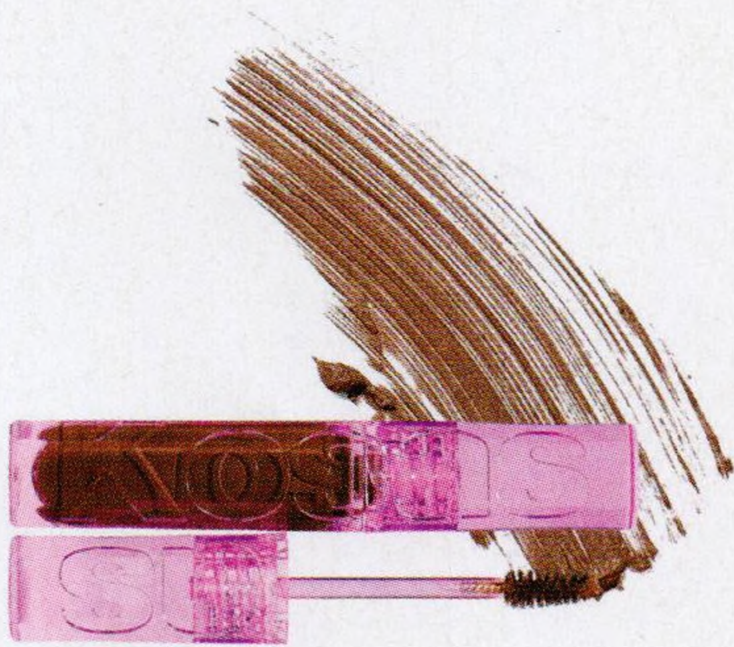
Jediná košťata, co potřebujete str. 56