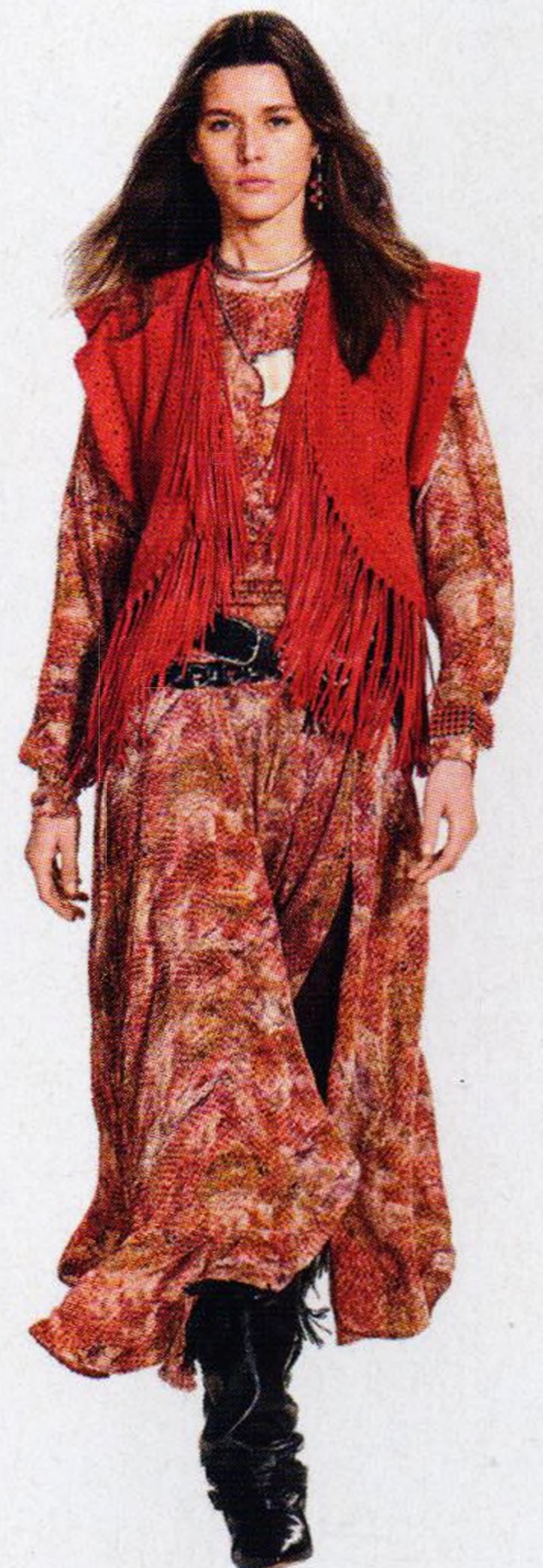
Velký comeback boho-chic str. 24