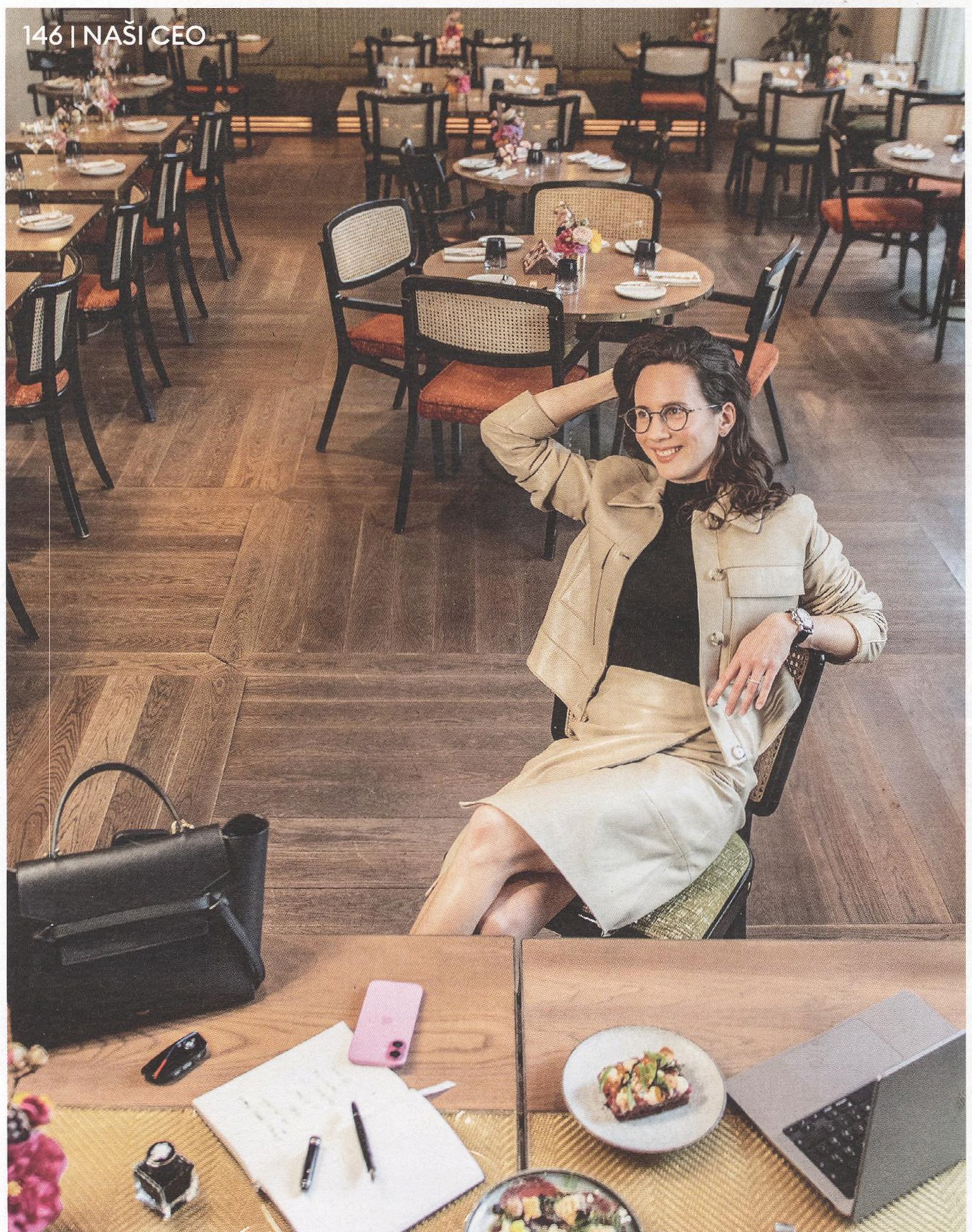
146 | NAŠI CEO