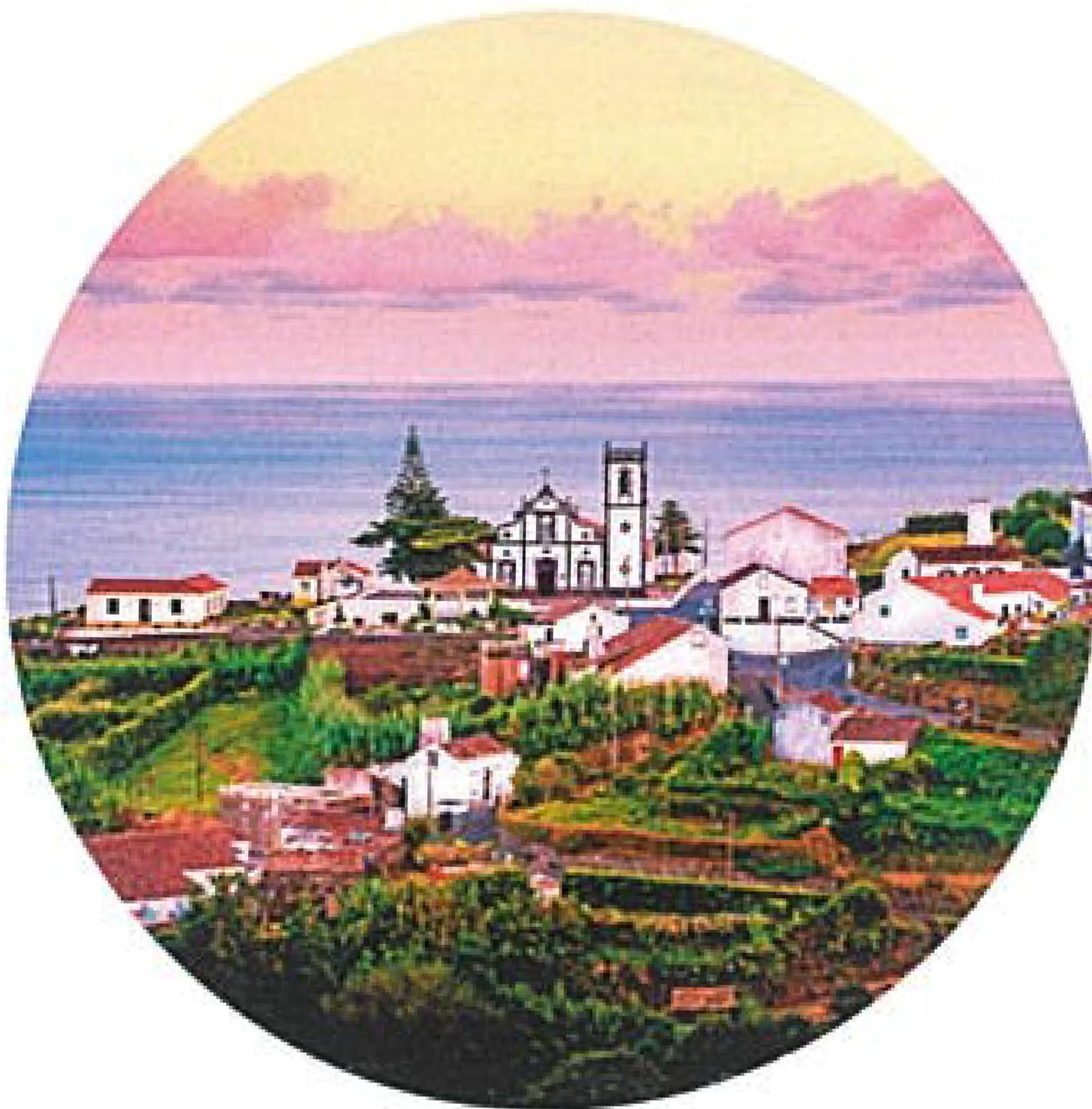
Nahoře: Nordeste (str. 49) Dole: Faial (str. 79)