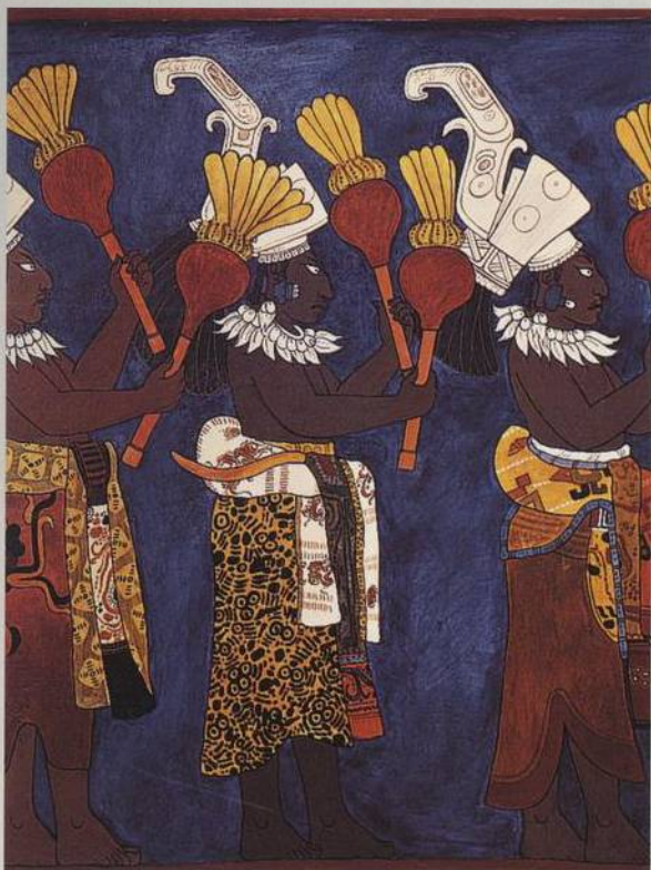
Mayští hudebníci na nástěnné malbě z Bonampaku v Mexiku