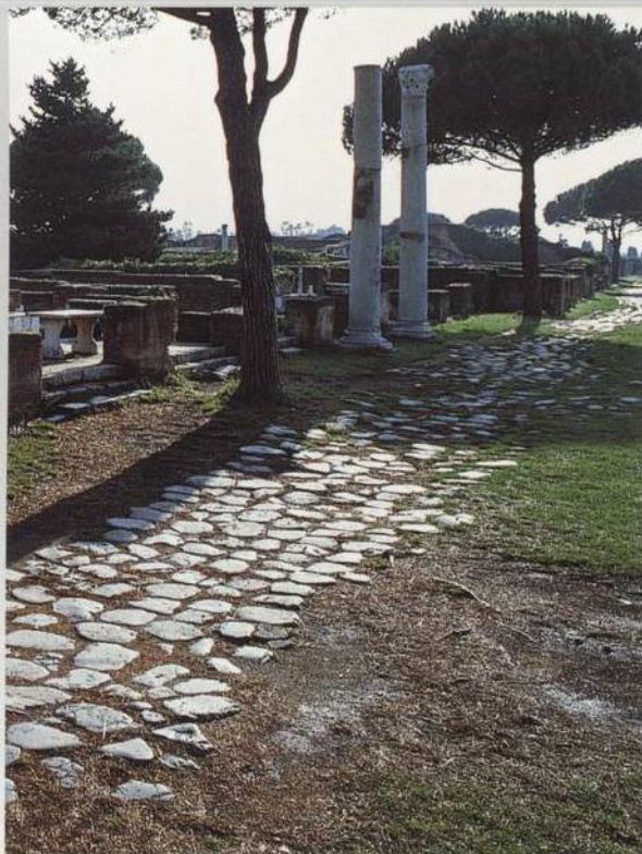
Římská silnice: Via Appia v Itálii