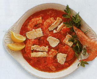
Garides saganaki – krevety se sýrem feta v rajske omáčke