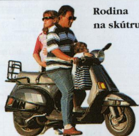
Rodina na skútru