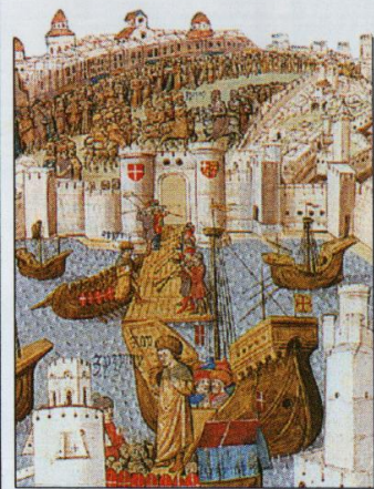
Turecký princ Džem připlouvá na Rhodos (15. století)