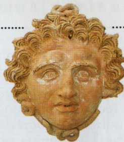
Hlava Gorgony z Euboie