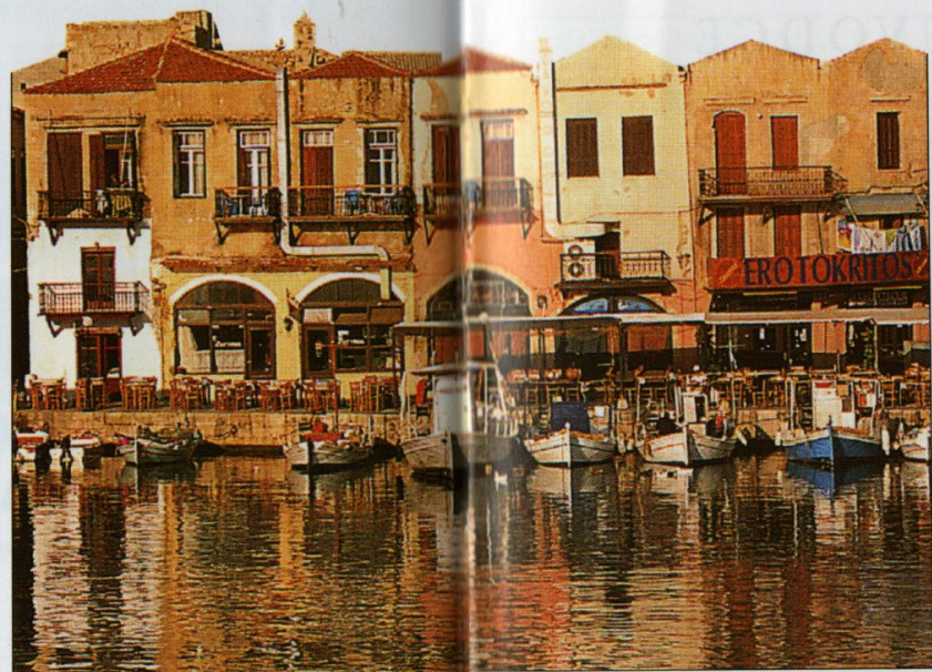
Přístav v krétském Réthymnu