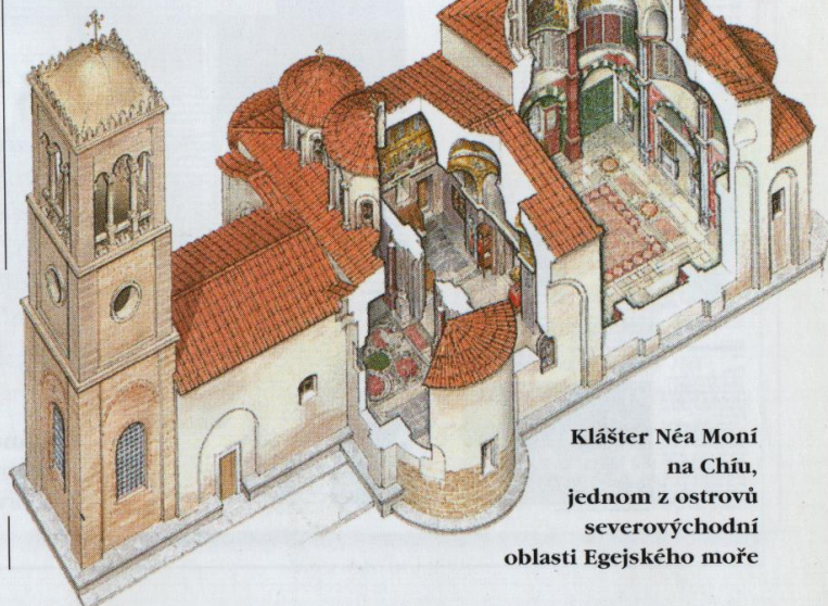
Klášter Néra Moní na Chíu, jednom z ostrovů severovýchodní oblasti Egejského moře