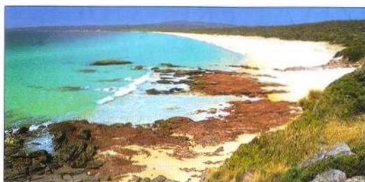
Ben Boyd National Park na jižním pobřeží Nového Jižního Walesu