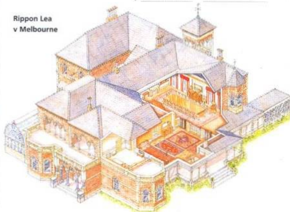
Rippon Lea v Melbourne

POLOOSTROV YORKE, EYRŮV POLOOSTROV A FAR NORTH 358