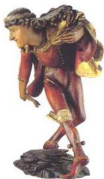
Socha tanečnicka v Městském muzeu v Mnichově (viz str. 214)