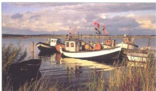
Malebná jezerní krajina v Meklenbursku