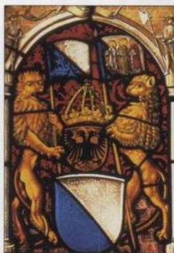
Znak Curychu, Schweizerisches Landesmuseum, Curych