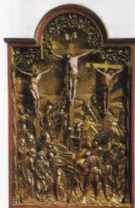
Deska oltářního obrazu z roku 1513 v ěglise des Cordeliers, Fribourg