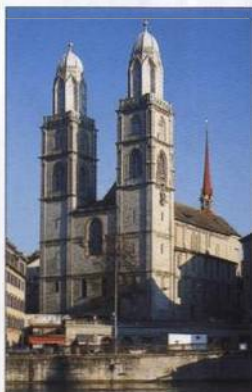
Mohutné věže Grossmünsteru, Curych