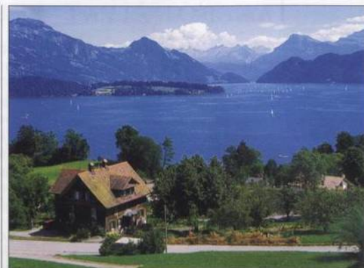
Vierwaldstättské jezero, zeměpisné a historické srdce Švýcarska