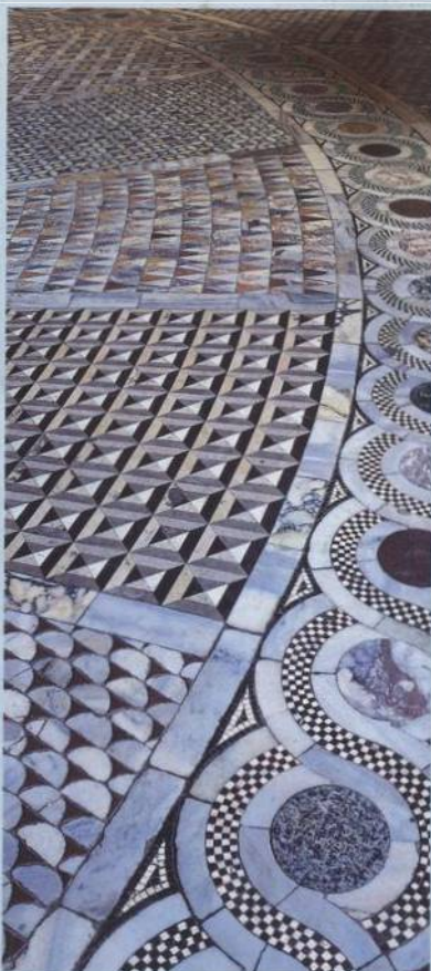
Podlaha v dómu sv. Marka si zaslouží vaši pozornost.

»Ostrov sklářů« připomíná svým hlavním kanálem a množstvím malých kanálů Benátky. ► strana 220