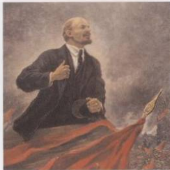
Lenin, vůdce bolševické Říjnové revoluce v Rusku s. 480