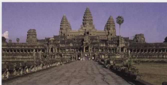
Architektura chrámů ztělesňujících filozofii: khméřský chrám Angkor Wat v kambodžské tropické džungli s. 246