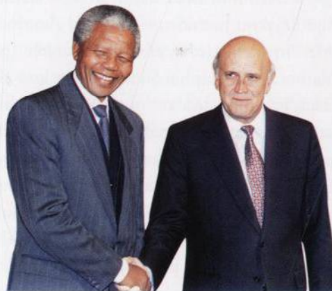
Nelson Mandela a Willem de Klerk si potřásají rukama a stvrzují konec apartheidu s. 633