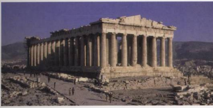
Chrám Parthenon na Akropoli: velkolepé dílo klasické řecké architektury vyjadřující moc athénské polis s. 87