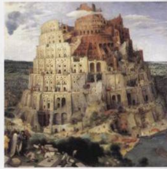
„Babylonská věž: mytické prolnání dávných kultur s. 41