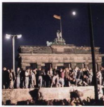
Obyvatelé Berlína slaví pád Berlínské zdi s. 544