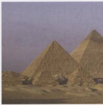
Egyptské pyramidy: obří monumenty prvích faraonů s. 43