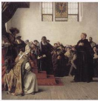
Reformace: Luther obhajuje své názory před císařem Karlem V. s. 256