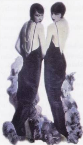
Androgynická elegance: dvě dámy z 20. let 20. století s. 506