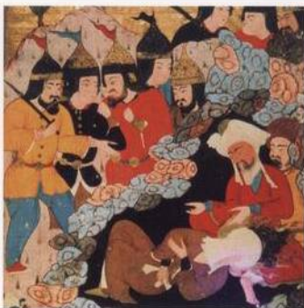
Perzekuce: prorok Muhammad se skrývá před svými nepřáteli s. 226