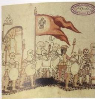
Dobývání: španělsí vojáci táhnou do mexické říše Aztéků s. 335