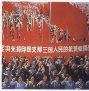
Veřejné odsouzení lidí při čínské kulturní revoluci s. 619