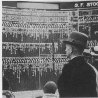
Světová hospodářská krize: zhroutil se burzy na černý pátek s. 506