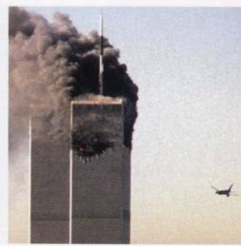
Okamžiky hrůzy: druhé letadlo nalétá do Světového obchodního centra s. 643