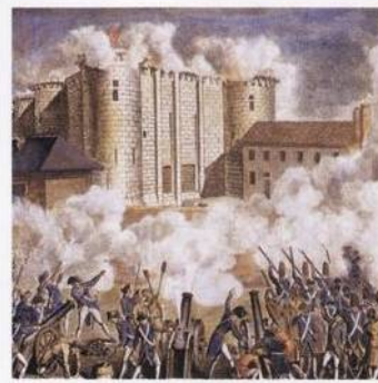
Útok na Bastillu: začátek francouzské revoluce s. 350

334 Staré americké říše a jejich dobytí Španěly a Portugalci