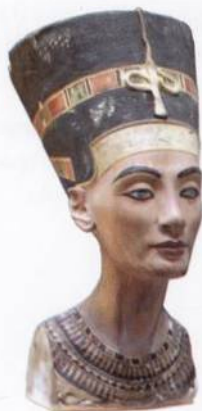
Kráska zahalená tajemstvím věků: egyptská královna Nefertiti s. 45