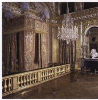
Palác ve Versailles: ložnice francouzského krále Ludvíka XIV. s. 279