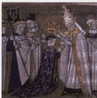
Korunovace: francký král Karel Veliký je korunován na císaře s. 165