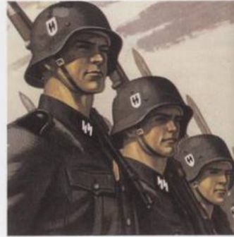
Plakát mezinárodní asociace nacistických SS s. 510