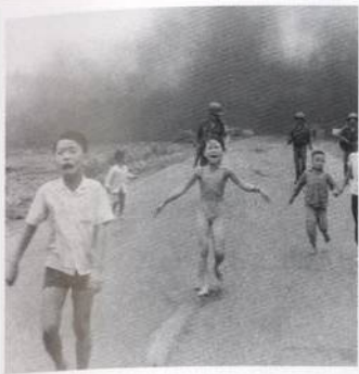
Vietnamské děti prchající před americkým útokem napalmem s. 617