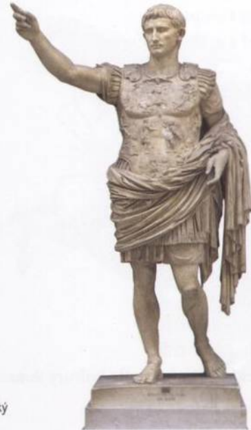
Augustus, první římský císař s. 122

154 První království v severní a severovýchodní Africe