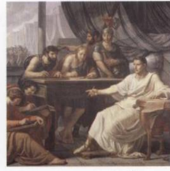
Jeden z největších vojevůdců Říma: Gaius Julius Caesar s. 120