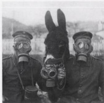
1. světová válka: člověk a zvíře v plynové masce s. 440