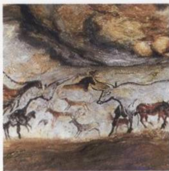
První umění lidstva: jeskynní malby z doby kamenné s. 21