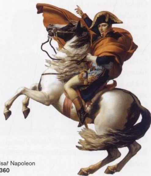
Francouzský císař Napoleon Bonaparte s. 360