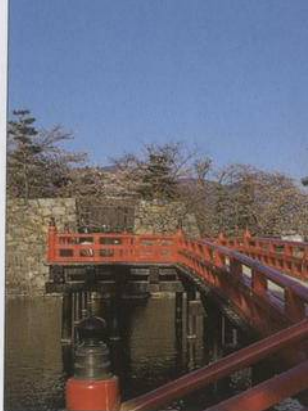
Zámek Macumoto v Japonských Alpách