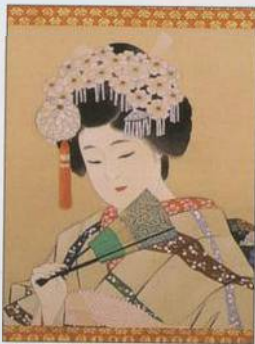
Závěs s vyobrazením gejši v muzeu v Takajamě