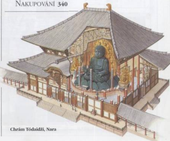
Chrám Tódaidži, Nara