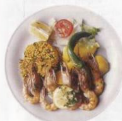
Dary moře – základ tuniské kuchyně