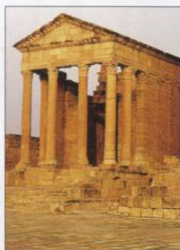
Rozvaliny římského chrámu na Kapitulu, Dougga