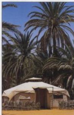
Pohodlné stany pro turisty v Ksar Ghilane