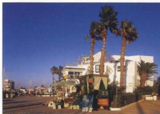
Turistické centrum v Port el-Kantaoui