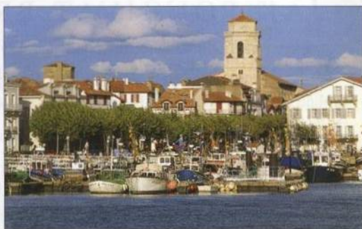
Rybářská vesnice St-Jean-de-Luz v Pyrenejích