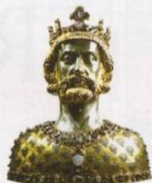
Busta Karla I. Velikého