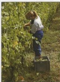
Vinobraní v Alsasku