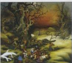
Mijo Kovačić: Dřevorubci , Muzeum naivního umění v Záhřebu