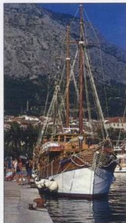
Rušný přístav ve městě Makarska