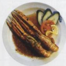
Buzara (mošti ráčci v rajské omáče) – typické dalmatské jídlo