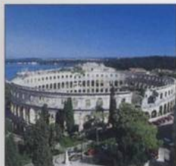
Římský amfiteátr v Pule